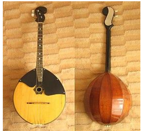
Şəkil 2 (Rus domrası)

Rus domrası 3 simli olur (Şəkil 2). Simləri kvarta intervalı ilə köklənir. Belarusiya və Ukraynada istifadə olunan domralar isə 4 simli olur və kvinta ilə köklənir. Bas domra Rusiyada XVI-XVII əsrlərdə aktyor təlxəklər tərəfindən solo və ansambl aləti kimi istifadə edilirdi. Lakin XVII əsrin əvvəllərindən başlayaraq çar tərəfindən bir sıra dövlət və kilsə qanunları verildikdən sonra təlxəklərin yoxa çıxması ilə domra da yoxa çıxdı. Çar Aleksey Mixaylovun “Əxlaqın düzəldilməsi və xurafatın məhv edilməsi” haqqında qanun bu prosesə təkan vermiş