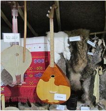
Şəkil 3 (Başqırd dumbrası)

Tənbur alətinin bir növü başqırdlar tərəfindən də istifadə olunur. Başqırdlar bu aləti “dumbra” adlandırırlar (Şəkil 3).