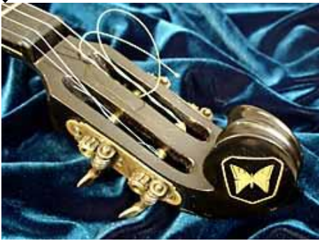
Şəkil 5. (V. Konveqin işlərindən)

Beləliklə, araşdırmalardan belə aydın oldu ki, tənbur aləti türk və qeyri-türk mənşəli bir çox xalqlarda istifadə olunan ən qədim alətlərdəndir. Bütün bunlar tənburun tarixən türklər tərəfindən çox sevilən alət olduğunu və sırf türk aləti olduğunu göstərir. Düşünürük ki, bu alətin Rusiyada istifadəsi bu ərazidə yaşayan türk tayfalarının (xüsusən başqordlar, sibir türkləri və s.) mədəniyyətini mənimsəməsi ilə bağlıdır. Alətin Çində istifadəsi də türk mənşəli uşaqların bu ərazilərdə yaşaması ilə əlaqədar ola bilər. Beləcə, türklərin yayıldığı ərazilərdə və ya xalqların tarixi köçü, tayfaların yerdəyişməsi, türklərin daha çox köçəri həyat sürməsi nəticəsində məskən saldıqları ərazilərdə bu alət yayılıb və başqa xalqlar tərəfindən də mənimsənilib. Məhz buna görə də tənburun yayılma arealı genişdir. Bu gün Azərbaycanın da bəzi bölgələrində bu alətdən istifadə olunsa da tənburun yenidən bərpa və təkmilləşdirilməsinə ehtiyac var.