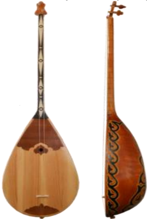
Şəkil 1 (Qazax dombrası)

S.Abdullayeva tənbur aləti haqqında yazmışdı: “Bu alətə həm də tambur, tonpur, tunpur deyirlər [1, s. 113]. A.Nəcəfzadənin yuxarıda adını çəkilmiş məqaləsindən aldığımız nəticəyə görə dambur elə tənburun bir növüdür. Eyni zamanda “tənbur” sözünün Balakən, Qax, Zaqatala bölgəsində yerli ləhcədə “dambur”a çevrilmişdir [7, s. 111].