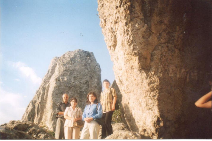
Şəkil 11. 2 dənizin qovuşduğu yerdə 2 qayanın arası –