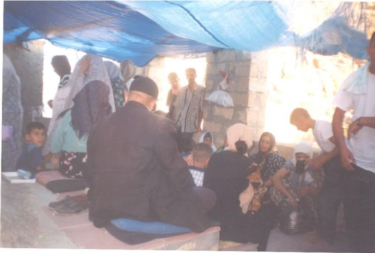
Şəkil 8. Xıdır Zindənin doğum günü qeyd olunur