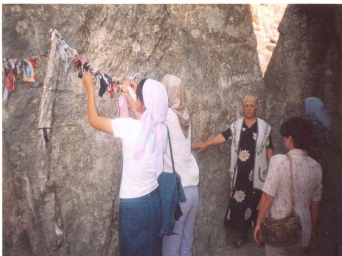
Şəkil 6. Xıdır Zində ziyarətgahında arzu tuturlar