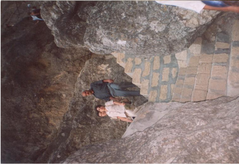
Şəkil 10. Xıdır Zində babanı