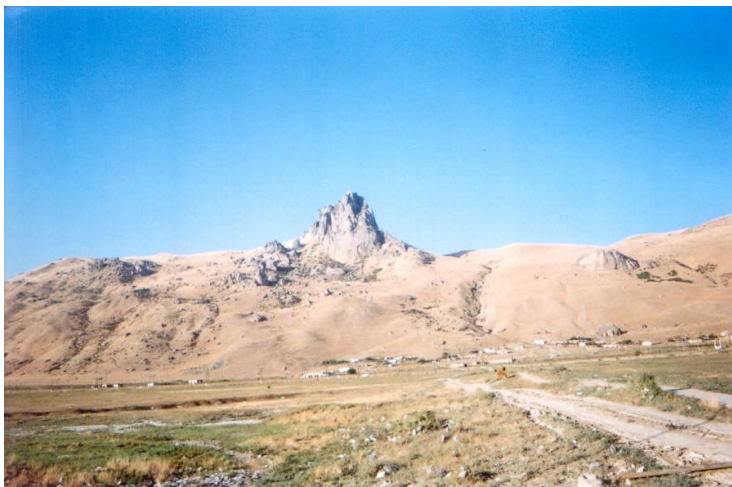
Şəkil 5. Beşbarmaq dağı, Xıdır Zində ziyarətgahı