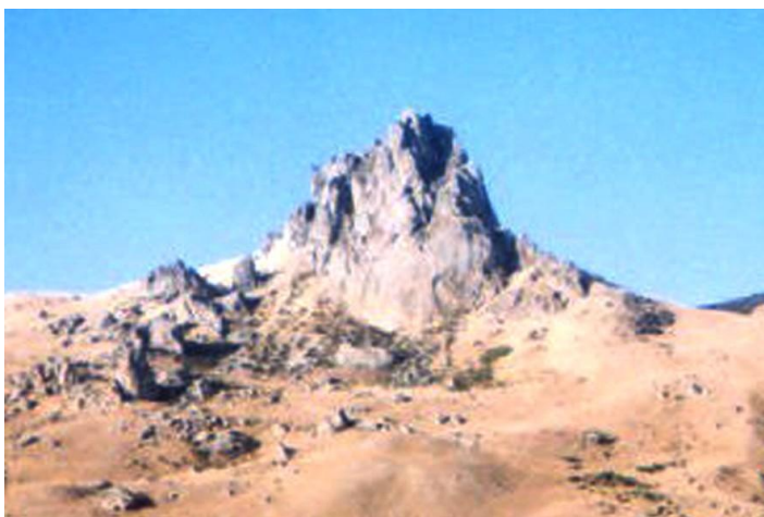
Şəkil 4. Beşbarmaq dağı, Xıdır Zində ziyarətgahı