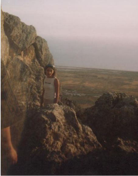
Şəkil 12. 2 dənizin qovuşduğu yerdə –Xıdır Zində dağı