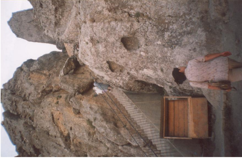
Şəkil 9. Xıdır Zindənin doğum günü qeyd olunur.