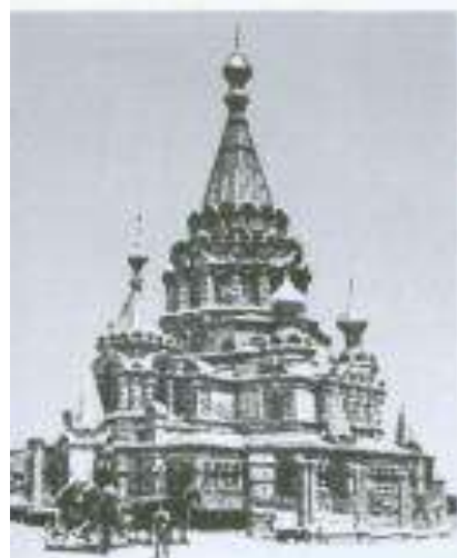
Bakıda Pravoslav kilsəsi