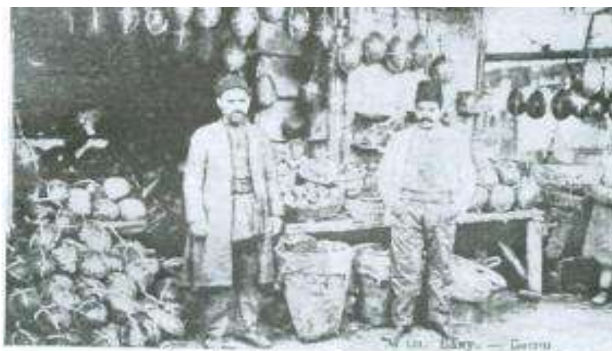
Baqçal dükanı. Meyve furuş