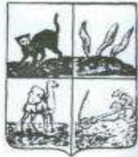
Bəki şəhərinin ilk gerbi