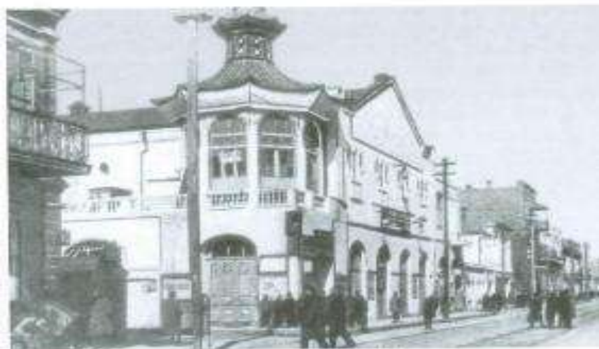
"Mikado" teatrının binası