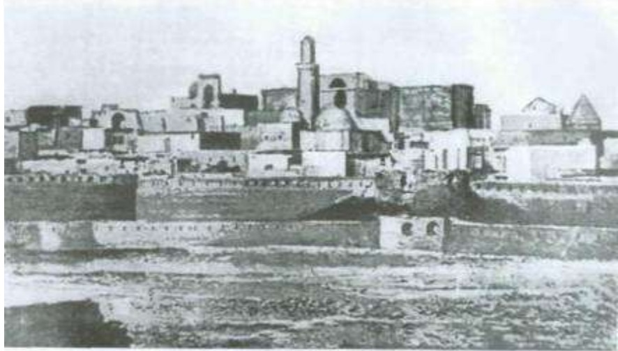
İçeri şehir. XVIII əsr.