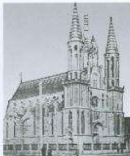
Bakıda Roma-katolik kilsəsi