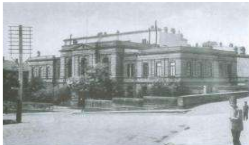
Bakı gimnaziya binası