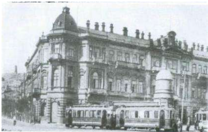
1919-cu ildə milli hökumət bu binada yerləşirdi.