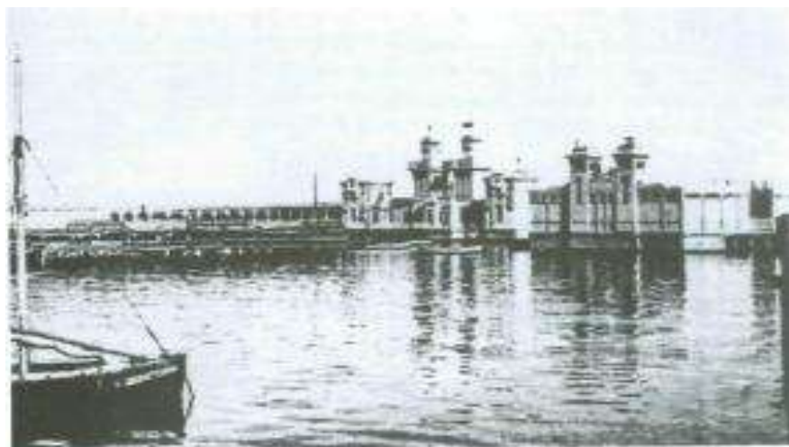
Bakı dəniz hamamı