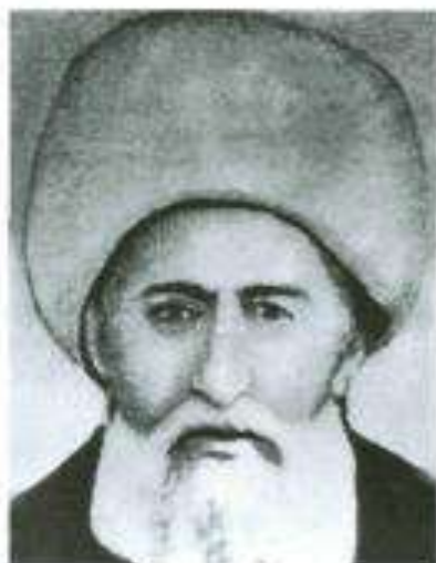
Axund Mirzə Əbu Turab Axundzadə