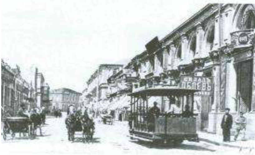
Keçmiş Olqa indiki M.Ə.Rəsulzadə küçəsi