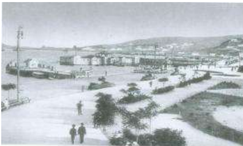
Dənizkənarı bulvar. Əsrin əvvəlində