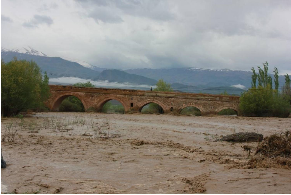
Şəkil 1. a) Mardinli artuklularından Nasirəddin Artuk Arslana (1200-1239) aid mis sikkə (1231). b) Beş tağlı Aza körpüsü