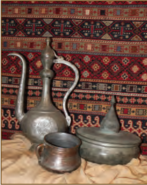
Müasir interyerdə mis

XX əsrin əvvəllərindən etibarən fabrik-zavod istehsalı qabların Azərbaycanda kütləvi şəkildə yayılması mis qab istehsalını tənəzzülə uğratmış və mis qablar tədricən məişəti tərk edərək, muzey fondlarının dəyərli eksponatlarına çevrilmişlər. Bununla belə, mis qazan və məcməyilərin, xüsusən də “xeyir-şər” qazanlarının istehsalı XX əsrin 80-ci illərinə qədər davam etmişdir. Stalin dövrünün xalqımıza gətirdiyi ağır bəlalar sənətkarlıqdan da yan keçməmiş, ustad sənətkarların aradan götürülməsi ilə yanaşı, sənətkarlıq məhsullarının məhv edilməsinə də səbəb olmuşdur. “Kulak”a düşmək təhlükəsindən qorunmaq üçün bir qisim insanlar evlərində olan dəyərli əşyaları (xalça, mis qab) torpağa basdırır, üzərinə su axıdaraq çürütməyə çalışırdılar(40). 1963-cü ildə