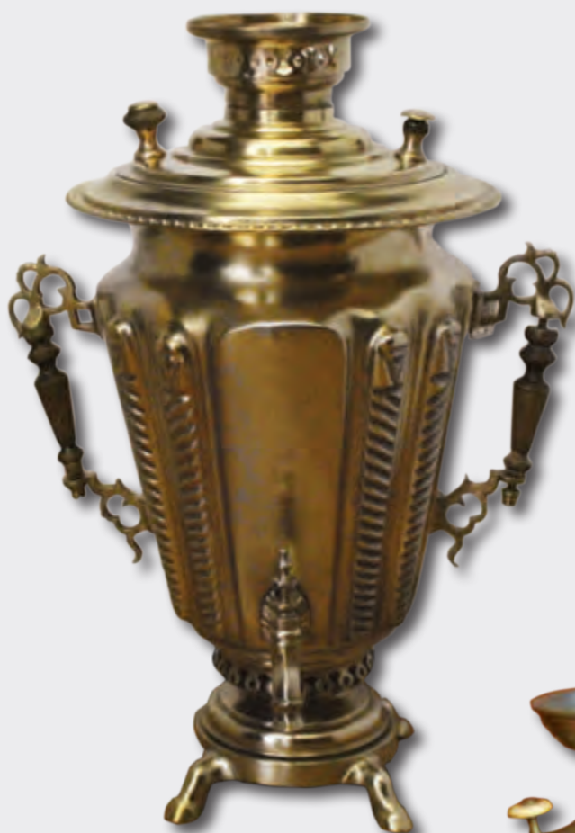
Samovar Hündürlüyü: 52 sm IX sər. Rusiya EF 9330