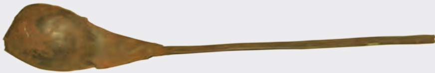
Gədəbəy mis emalı zavodunun fəhlələrinin istifadə etdiyi əmək aləti (ödrəng)

Milli Azərbaycan Tarixi Muzeyinin Sənədli mənbələr fondunda mühafizə olunan Gədəbəy mis emalı zavodunun fəhlələrinə məxsus materiallar zavodda istifadə olunan əmək alətləri, eləcə də fəhlələrin məişəti haqqında müəyyən məlumat əldə etmək imkanı verir. Qeyd edək ki, həmin materiallar 5 yanvar 1959-cu ildə muzeyin sabiq əməkdaşı Marat İbrahimov tərəfindən toplanaraq muzeyə təhvil verilmişdir (21 s.v.).