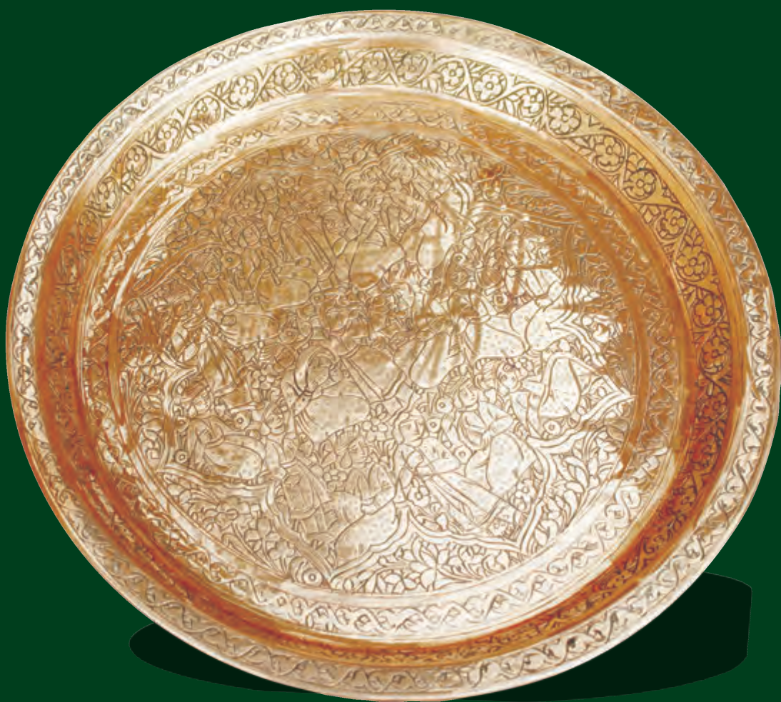
Diametri: 19,3 sm dəriniyi: 1,8 sm XVI-XVII əsrlər EF 297

Bu qab da öz növbəsində siniyə nisbətən kiçik olub, süfrədə boşqab funksiyasını yerinə yetirir; həmçinin kiçik tutumlu qazanların, tava, qablama, saplıca və s. qabların ağzını qapamaq üçün istifadə olunurdu. Etnoqrafiya fondunun EF 1701, EF 1923, EF 2070, EF 6204, EF 6281 sayılı inventarlarına əsasən nimçələrdən həmçinin ocaq üstünə qoyularaq müəyyən xörəklərin (qayğanaq, quymaq, az miqdarda paxlava və s.) bişirilməsi və ya qızdırılması üçün istifadə olunduğunu da demək olar. Həmin döyrələrin altını tamamilə his tutmuşdur.