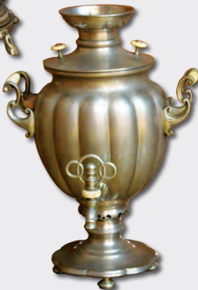
Hündürlüyü: 51 sm XIX əsr. Avropa EF 9405