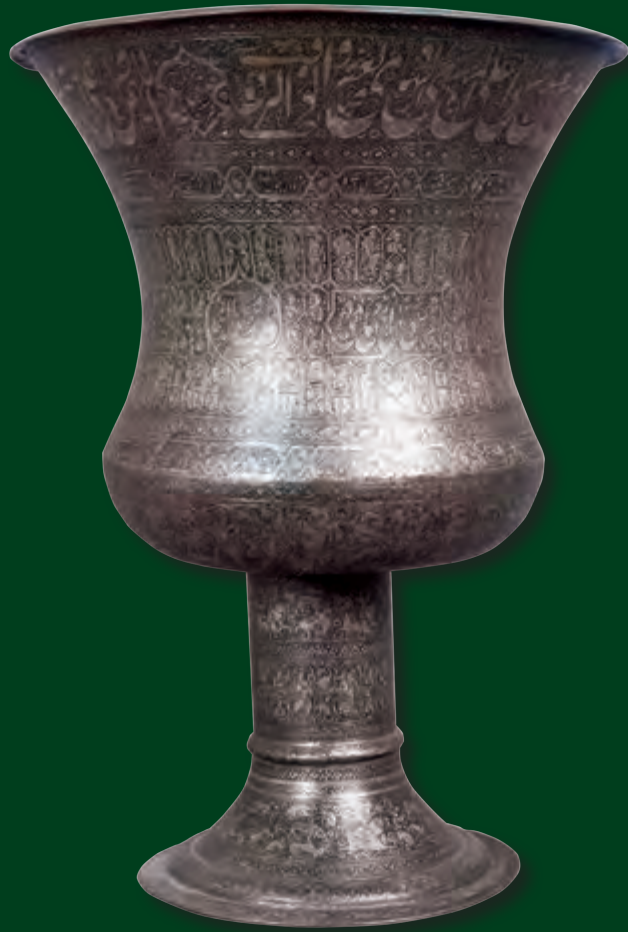
Ağzının dm: 46 sm oturacağıının dm: 28 sm hündürlüyü: 58 sm EF 341

Şərbətxorlar Azərbaycanın məişət mədəniyyətinin Şərqi mədəniyyəti ilə bağlılığının gözəl nümunəsidir. Şərbətxorlar yalnız mərasim məclislərində - nişan və yaslarda istifadə olunurdu. Təsadüfi deyil ki, bəzi etnoqrafik bölgələrimizdə nişan mərasimi həm də “şirni” adlanır. Müqəddəs aşura günlərində məscidlərdə şərbət ehsanı paylanması adəti bu günə qədər qalmışdır. XIX əsrdə iri tutumlu şərbət qabları da bu məqsədlə istifadə olunmuşdur. Xüsusi şərbət qaşığının və şərbətxor çömçəsinin vasitəsilə şərbət piyalələrə və xalq arasında “şərbəti” adlanan kiçik həcmli qablara tökülərək paylanırdı. Xalq təbabətinə görə şirin qidalar və içkilər əhvali-ruhiyyəni qaldırmaq və ürəyi qüvvətləndirmək qabiliyyətinə malikdir (tərkibində qlükozanın olması ilə əlaqədardır). Halva və şərbətin yas mərasimlərinin əsas qidasına çevrilməsinin başlıca səbəbi bununla bağlıdır. Ulularımız dərd-qəmin ürəyi zəiflətməsinin, orqanizmin gücdən düşməsinin qarşısını almaq məqsədilə xüsusilə yas mərasimlərində, hüznü günlərdə şirin qidaların qəbulunu tibbi baxımdan əhəmiyyətli hesab etmişlər