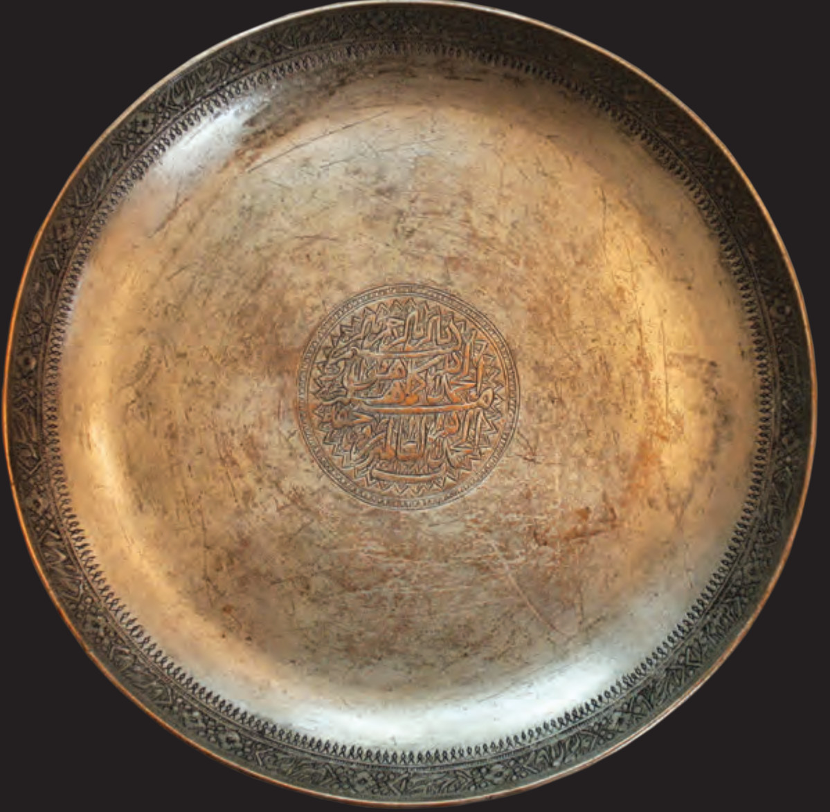
Ağzının dm: 25,5 sm oturacağıının dm: 15 sm dərinliyi: 2,5 sm h. 1288 / m. 1871-1872 EF 4138 Kitabə: Dua