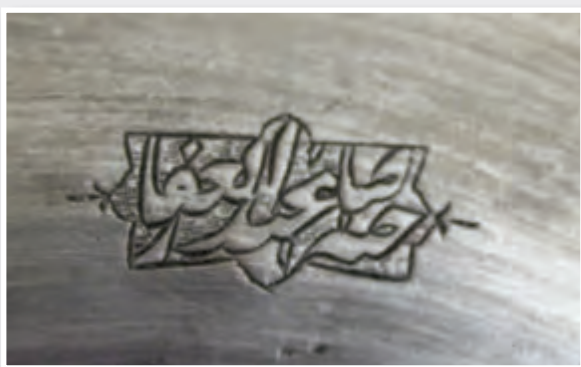
Ağzının dm: 25,5 sm oturacağıının dm: 16 sm dərinliyi: 3,5 sm h. 1259 / m. 1843 EF 8330 Kitabə: Dua. Sahibi Əbdülqafar