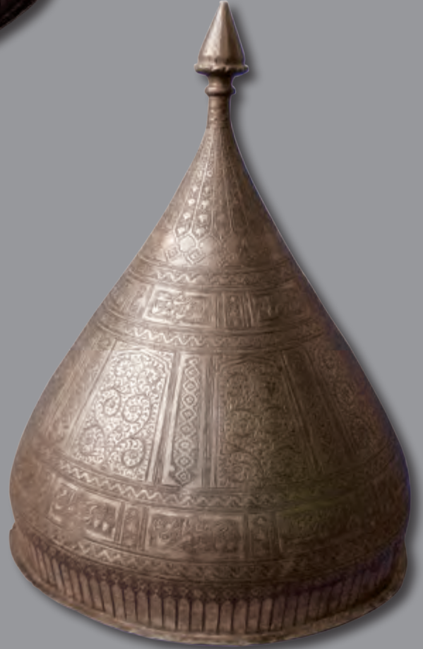
Diametri: 24 sm hündürlüyü: 29 sm XIX əsr EF 9627 Kitabə: Sədi Şirazinin qəzəllərindən