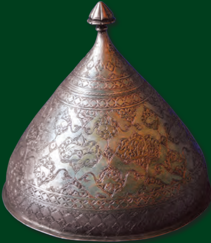
Diametri: 22,5 sm hündürlüyü: 25,5 sm XIX əsr EF 308

Süfrə qabları sırasına daxil olan ən geniş yayılmış qablardan biri də sərpuşdur. Farscadan tərcümədə “qapaq” mənasını verir və süfrədə də bu funksiyanı yerinə yetirir. Texnoloji baxımdan elə hazırlanmışdır ki, xörəkləri, xüsusən plovu, uzun müddət isti saxlamaq qabiliyyətinə malikdir. Konusvari formaya malik, getdikcə daralaraq günbəz formasını alan sərpuşda kondensasiya nəticəsində buxar aşağıdan yuxarıya doğru qalxır, yuxarı hissə daraldığından buxar yayılmağa və suya çevrilməyə imkan tapmır, qabın divarları ilə aşağıya doğru hərəkət edir və nəticədə termos effekti yaranır. Bu effektin sayəsində xörək bir müddət isti qalır. Sərpuşların ölçülərinə əsasən onların daha çox nimçələrin və qablama qazanların ağzına qoyularaq istifadə edildiyini söyləmək mümkündür. Fondada yalnız EF 4730 inventar saylı sərpuş nisbətən iri həcmlidir (38, 5 sm). Sərpuşları nimçə və sinilərin, eləcə də qablama qazanların ağzına qoyaraq süfrəyə verir, bununla yanaşı həmçinin ocaq üstünə qoyaraq bozbaş, piti, qablama və s. yeməklərin hazırlanmasında istifadə edirdilər.