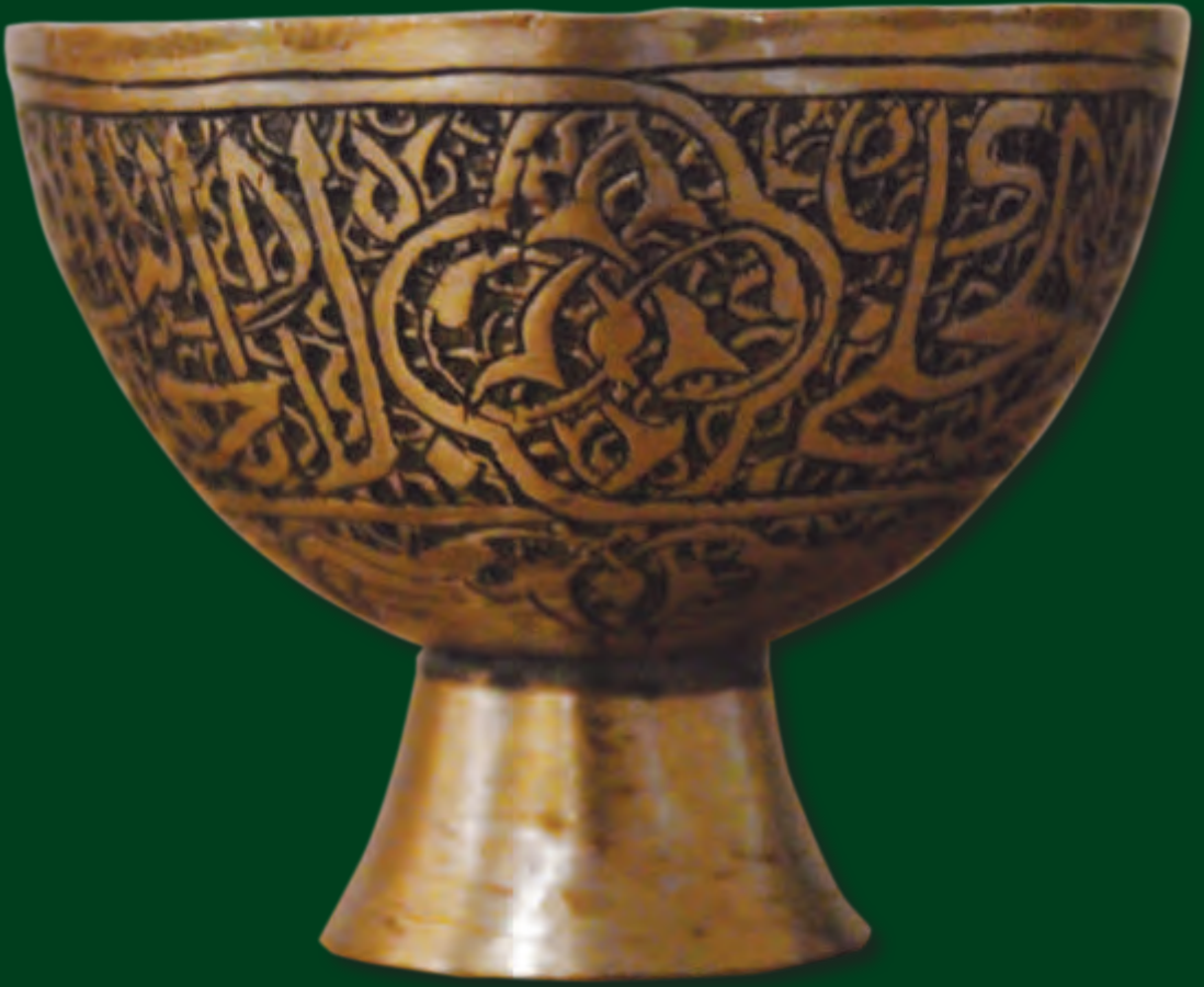
Badə. Hündürlüyü: 4,5 sm ağzının dm: 5,7 sm XVI-XVII əsr EF 289

Dastanlarda və klassik poeziya nümunələrində badələrin adına tez-tez rast gəlinir. Badələr müxtəlif formalarda, əsasən latundan (sarı misdən) hazırlanmışdır. Fondada olan bütün badələr yüksək dekorativ bəzəkləri ilə diqqəti cəlb edir. Bu, badələrin varlı süfrələrində istifadə olunduğunu göstərir.