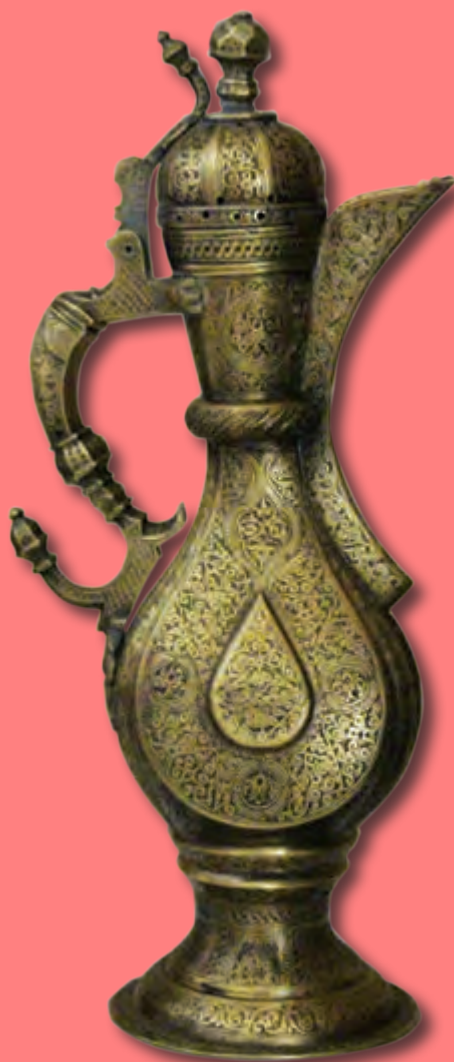
Qəhvədan Hündürlüyü: 32 sm XIX əsr. Özbəkistan EF 3719