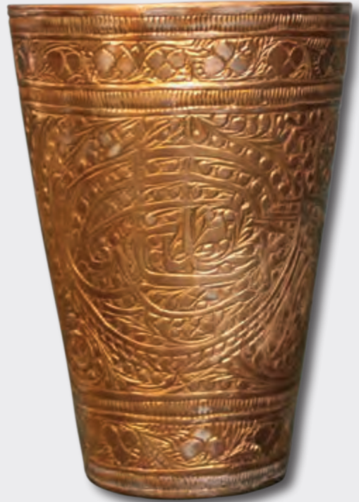
Hündürlüyü: 10,4 sm oturacağıının dm: 7,2 sm XVI-XVII əsrlər EF 4606