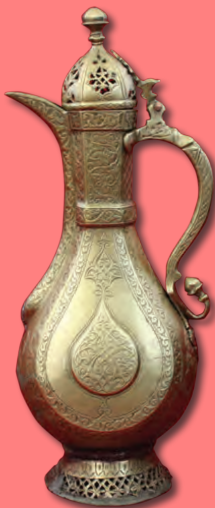
Qəhvədan Hündürlüyü: 29 sm XIX əsr. Özbəkistan EF 3714