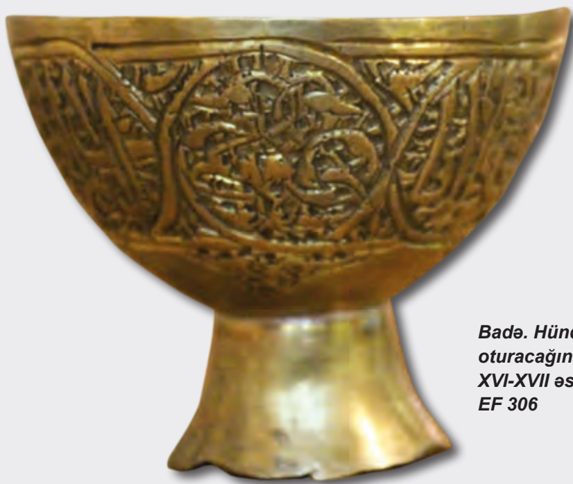
Badə. Hündürlüyü: 4,5 sm oturacağıının dm: 5,7 sm XVI-XVII əsrlər EF 306