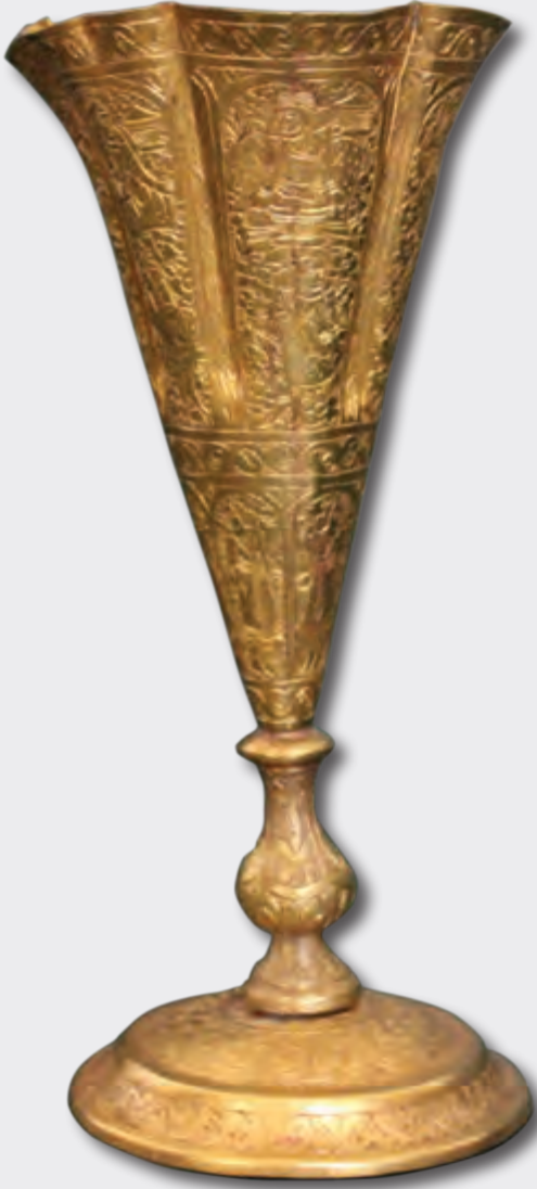
Hündürlüyü: 19 sm oturacağıının dm: 8 sm XVI-XVII əsr EF 1741