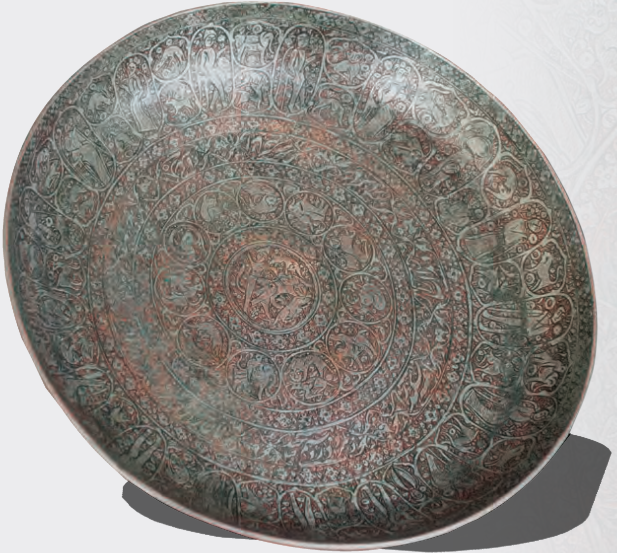
Ağzının dm: 22,7 sm oturacağıının dm: 18 sm dərinliyi: 3 sm XVIII əsr EF 5266 Kitabə: Sədi Şirazinin qəzəlindən