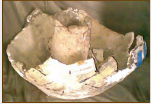
Daş samovar. E.ə. II minillik. Şəki

mümkündür. Fondada 45 s.v. samovar mühafizə olunur. Bundan başqa qəhvədan və dəm çaynıqlarını (15 s.v.) də süfrənin ayrılmaz tərkib hissəsi hesab etmək olar. Samovarlar əsasən Rusiya, Almaniya və Fransada istehsal olunmuşdur. Şəki şəhərindən tapılmış II minilliyə aid daş samovar isə Azərbaycan ərazisində samovarın daha qədim dövrə aid olmasını göstərən əşyayi- dəlildir.