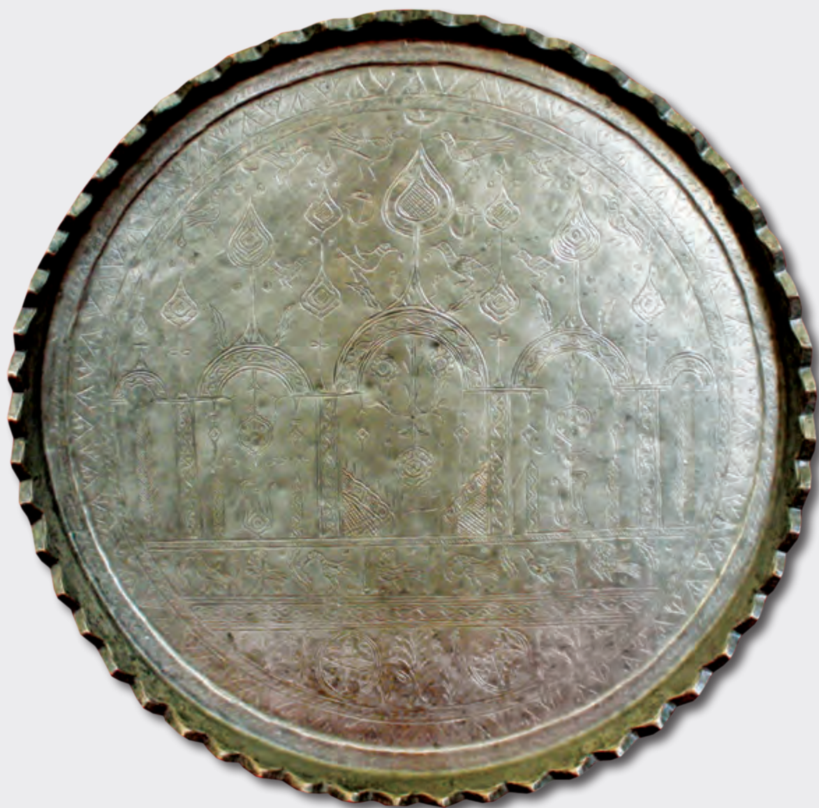
Ağzının dm: 28,5 sm oturacağıının dm: 18,5 sm XIX əsr EF 5553