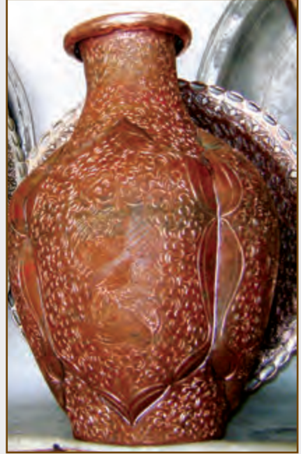
Mis qab. Lahic XXI əsr

sonlarına doğru istehsalın artan tempi sürətlə aşağı düşməyə başlayır. Məlumat üçün qeyd edək ki, Lahıca 1850-ci ildə 22 misgər dükkanı fəaliyyət göstərirdisə (35, s.5), 1884- cü ildə onların sayı artaraq 380 işçini birləşdirən 100 dükana çatmışdı (35, s.6). Artıq 1894-cü ildə bu dükanların sayı azalaraq, 140 misgərin işlədiyi 50 dükana düşür (35, s.10). XIX əsrin sonlarına aid bir mənbədə Lahıca qab istehsalının tənəzzülə uğramasının səbəbləri aşağıdakı kimi izah olunur: Cənubi Qafqazda mis mədənlərinin emalının əlverişliliyi qiymət artımına səbəb olan rəqabət yaratmışdı; misdən sənaye üsulu ilə ucuz qab istehsalı isə kустar istehsalı sıxışdırmağa başladı. Xammalın baha olması əl əməyinə əsaslanan qabların da baha başa gəlməsinə səbəb oldu ki, bu da istehsalçının gəlirlərini aşağı saldı. Bu vəziyyət sənətkarların əksəriyyətini işi dayandırmağa məcbur etdi (27, s. 101 ).