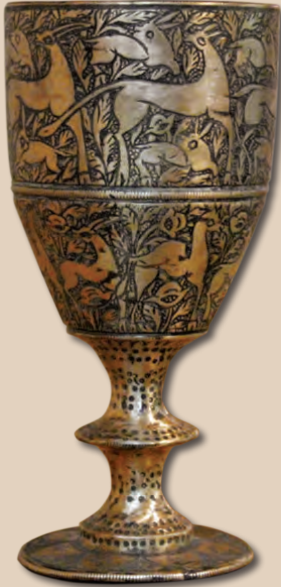
Oturacađın dm: 6 sm Hündürlüyü: 11,5 sm XVI-XVII əsr EF 4374