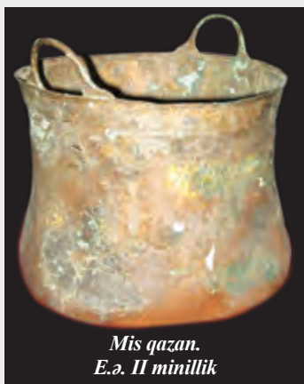
Mis qazan. E.ə. II minillik