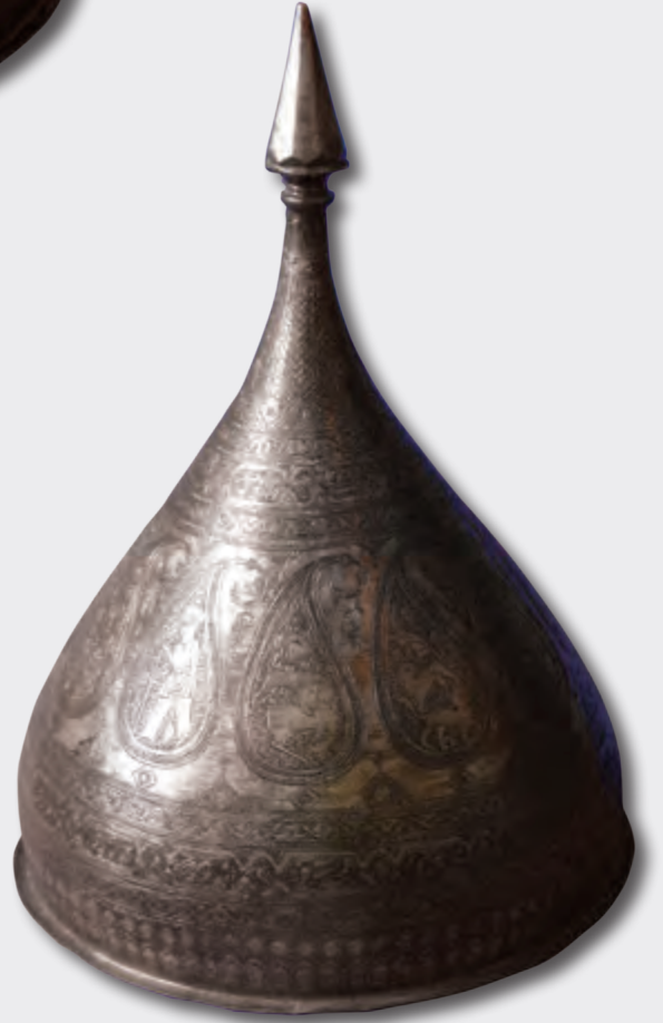
Diametri: 24 sm hündürlüyü: 32,5 sm XIX əsr EF 8739 Kitabə: Hafiz Şirazinin qəzəlindən