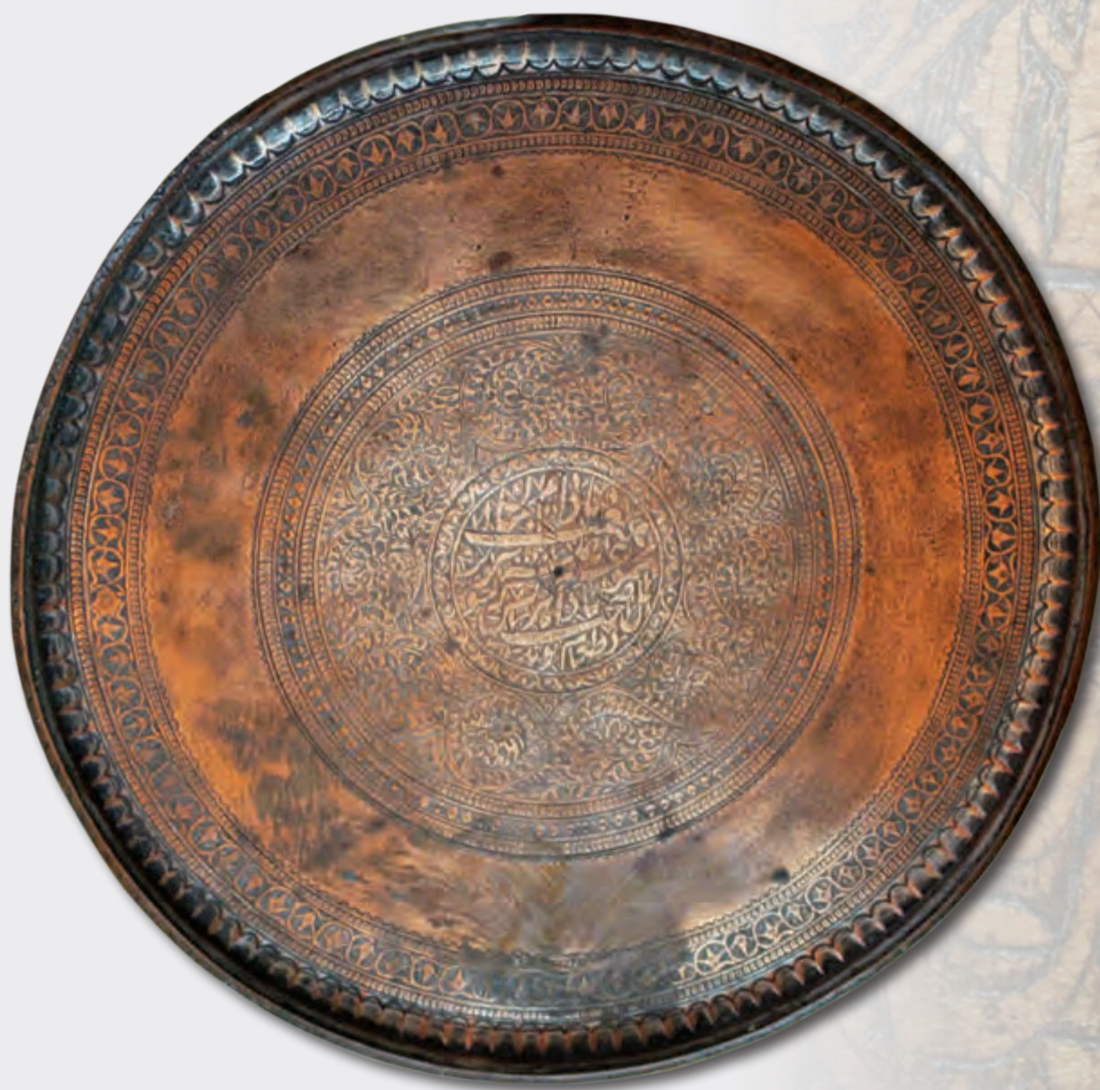
Diametri: 37.5 sm XIX əsr EF 9538 Kitabə: dua