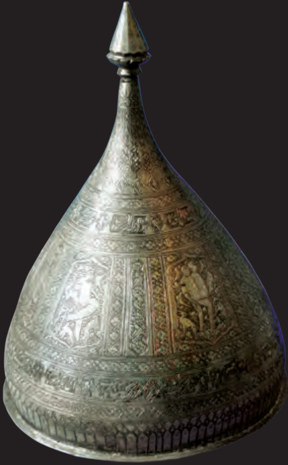
Diametri: 25 sm hündürlüyü: 35 sm XVIII əsr EF 3353 Kitabə: Sədi Şirazinin qəzələrindən