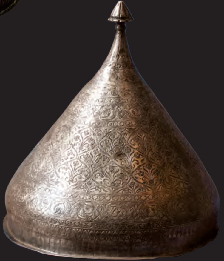
Diametri: 27,5 sm hündürlüyü: 28,9 sm XIX əsr EF 1996