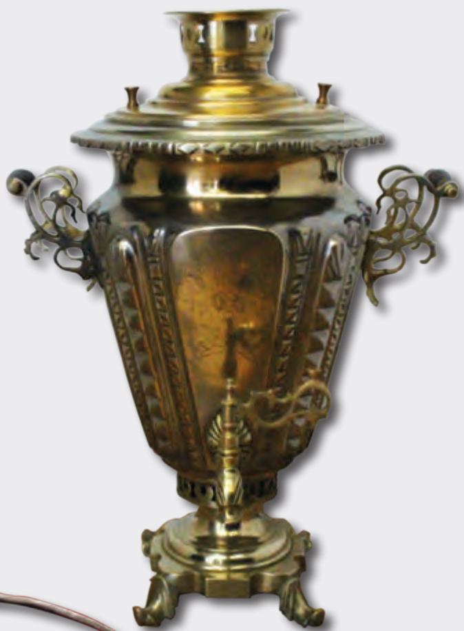
Samovar Hündürlüyü: 52 sm XIX əsr. Rusiya EF 7108