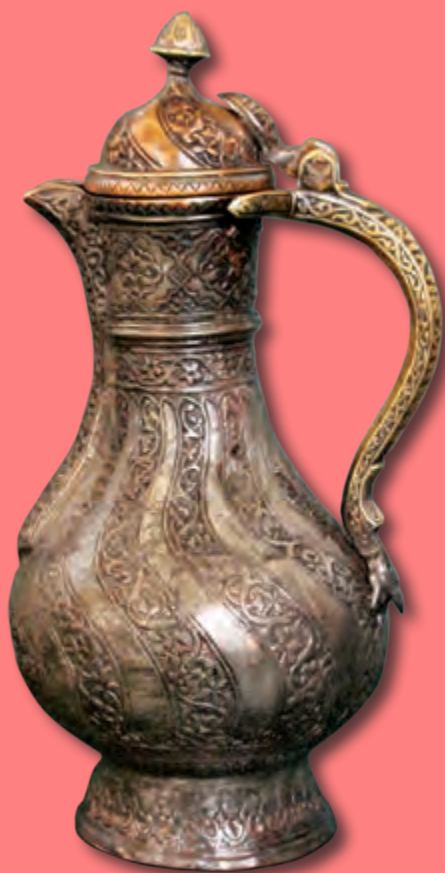
Qəhvədan (çoydiş) Hündürlüyü: 25 sm XIX əsr. Özbəkistan EF 3715