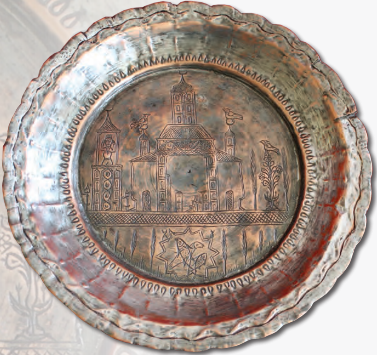
Ağzının dm: 25,8 sm oturacağıının dm: 12 sm dərinliyi: 3 sm XIX əsr EF 5196