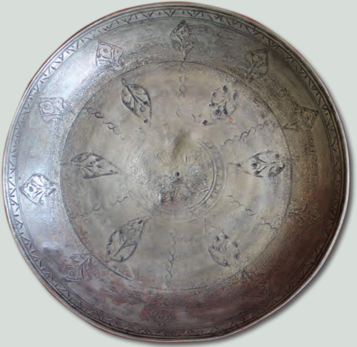
Ağzının dm: 28 sm oturacağıının dm: 14 sm dərinliyi: 3 sm XIX əsr Ef 4486