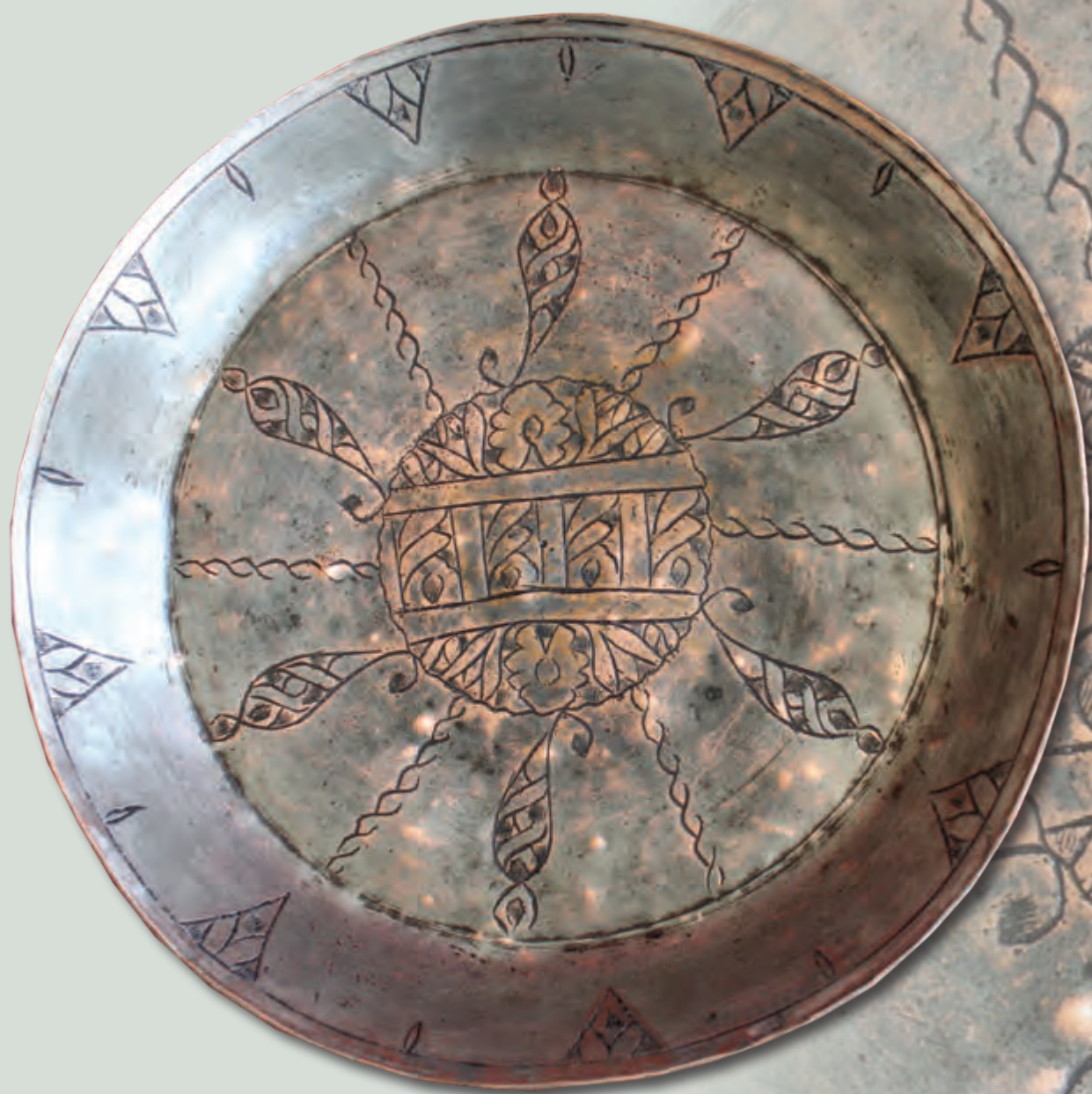
Ağzının dm: 29 sm oturacağıın dm: 16 sm dərinliyi: 6 sm XIX əsr EF 1923