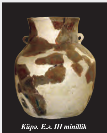
Küpə. E.ə. III minillik