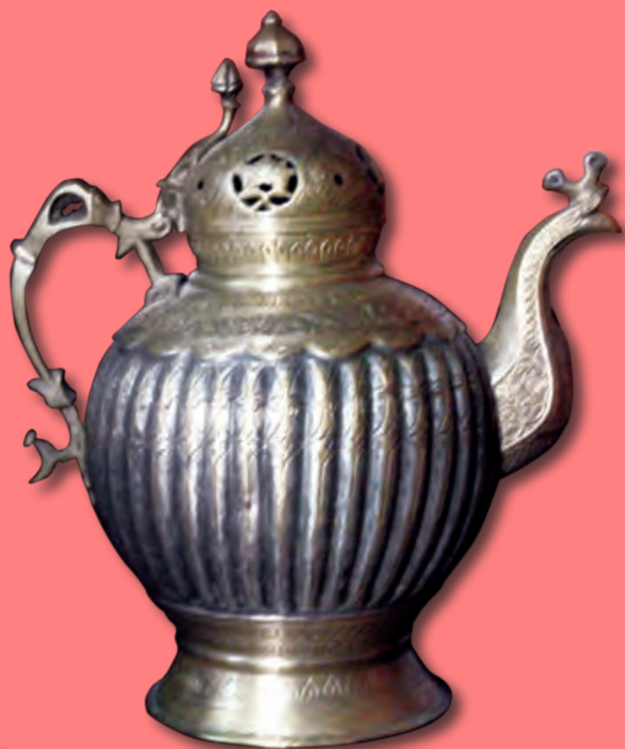
Çaynik Hündürlüyü: 23 sm XIX əsr. Özbəkistan. EF 1512