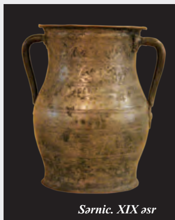
Sərnice. XIX əsr

Milli Azərbaycan Tarixi Muzeyində mühafizə olunan ən qədim mis qab nümunəsi Arxeologiya fondunda saxlanılan Əliköməktəpədəki torpaq qəbirdən tapılmış orta tunc dövrünə aid qazandır (23). Bu qazan bir növ XX əsrin ortalarına kimi xalqın istifadəsində olmuş sərnice və satılların oxşarıdır. Qazanın hər iki tərəfinə bərkidilmiş qulpları onun asılaraq istifadə olunduğunu göstərir. Maraqlıdır ki, dil yaddaşımızda qorunub saxlanan “yemək (xörək və ya qazan) asmaq” frazioloji ifadəsi vaxtilə qazanların asılaraq istifadə olunmasından qalan mirasdır (“aş” sözü də məhz buradan yaranmışdır).