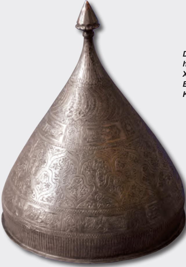
Diametri: 24,5 sm hündürlüyü: 28 sm XIX əsr EF 7373 Kitabə: Sədi Şirazinin qəzəllərindən