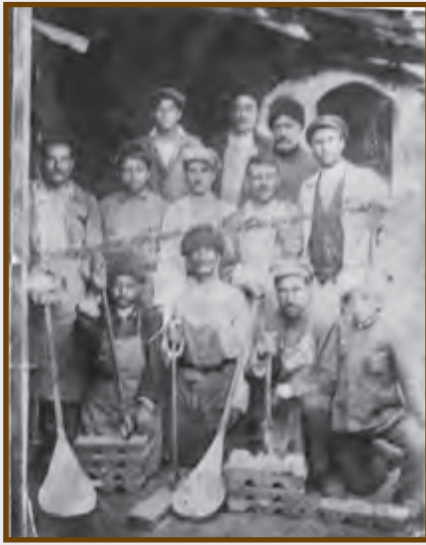
Gədəbəy mis emalı zavodunun fəhlələri

Azərbaycan misgərlik sənətini tarixən xammalla əsasən yerli mis mədənləri təmin etmişdir. Bununla yanaşı, orta əsrlərdə kənardan gətirilmə xammala da müraciət olunmuşdur. XIX əsrin ikinci yarısından etibarən Gədəbəy və Zəngəzur mis zavodlarının fəaliyyətə başlaması yerli mis istehsalının artımına səbəb olmuş,