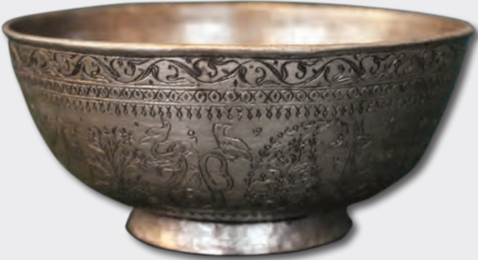
Kasa. Ağızının dm: 16 sm oturacağıının dm: 7.5 sm hündürlüyü: 10 sm XIX əsr. EF 9632