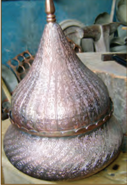
Mis qab. Lahic XXI əsr

məmulatlar çoxluq təşkil edir, misdən hazırlanmış bu növ qablarda, xüsusən “adam içinə çıxarılan” – yəni, sərpuş, qablama qazan, qapaq, nimçə, məcməyi, şərbətxor, güləbdan, cam, kasa, satıl və hamam taslarında təsadüf olunur. Bu kitabələrdə əsasən müqəddəs Qurani-Kərimdən ayələr, müqəddəslərin adları, klassiklərin əsərlərindən şeir parçaları,