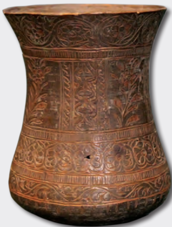
Armudu stəkan. Hündürlüyü: 9,5 sm oturacağıının dm: 7 sm XVI-XVII əsrlər EF 5925