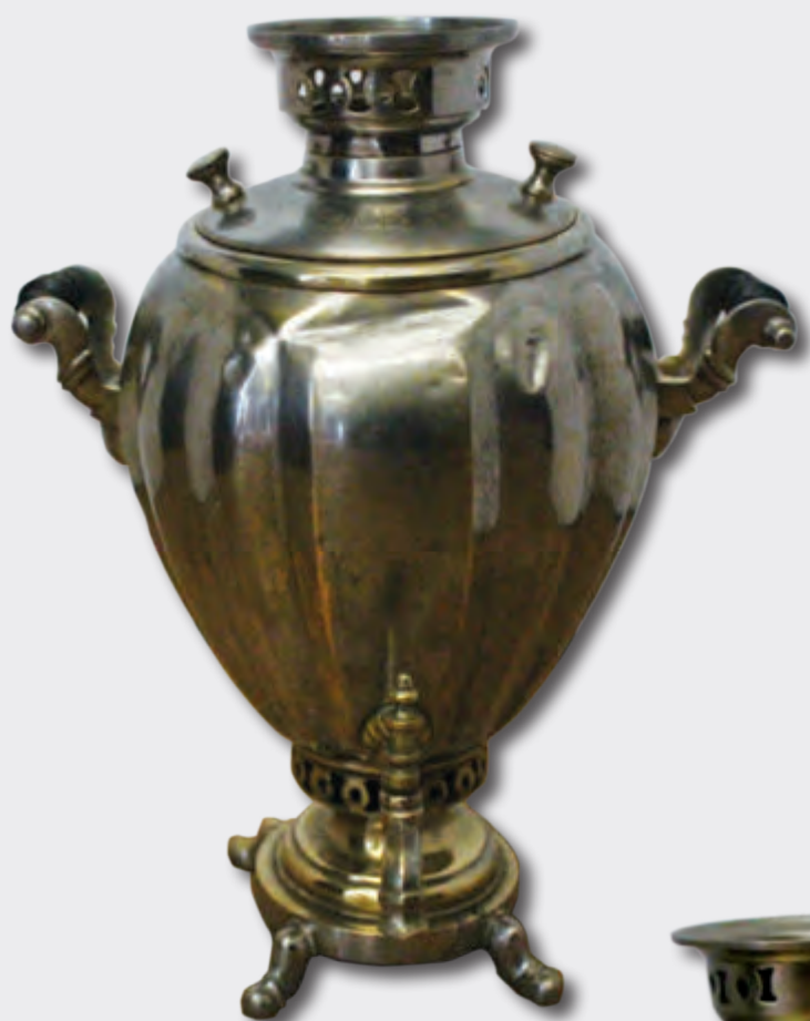
Samovar Hündürlüyü: 41 sm XIX əsr EF 6367