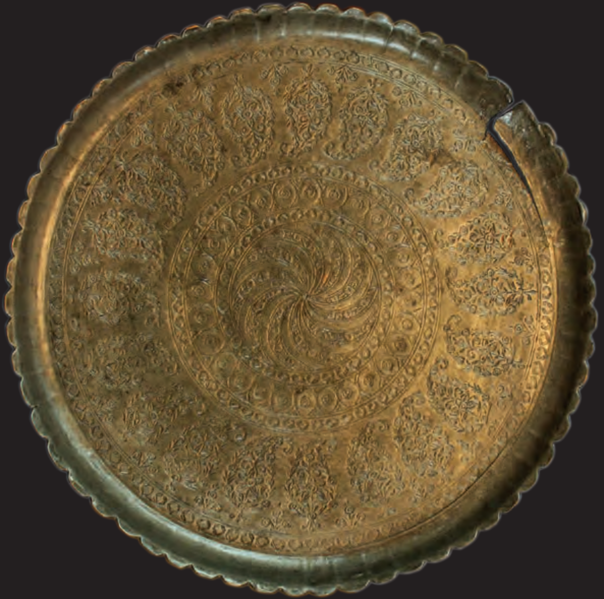
Diametri: 27 sm oturacađının dm: 25 sm dêrinliyi: 3 sm XIX êsr. EF 8703