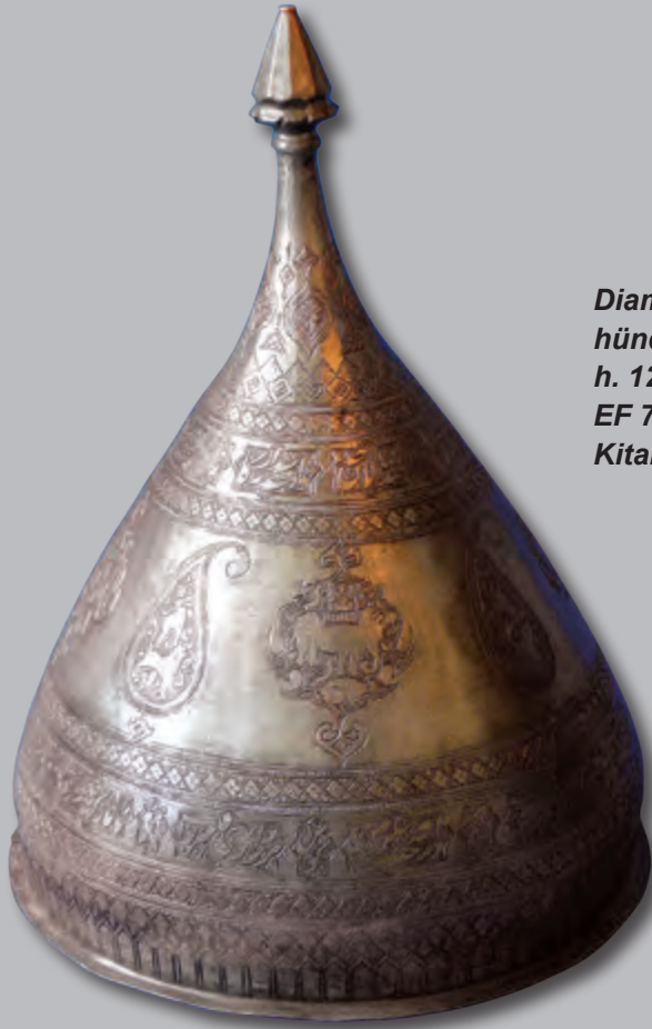
Diametri: 23 sm hündürlüyü: 32 sm h. 1200 / m. 1785-1786 EF 7378 Kitabə: Sədi və Hafizin qəzəllərindən