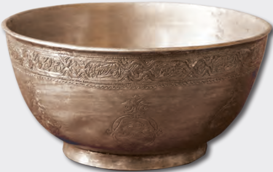
Kasa. Ağızının dm: 20,5 sm oturacağıının dm: 11 sm hündürlüyü: 9 sm XIX əsr EF 6928