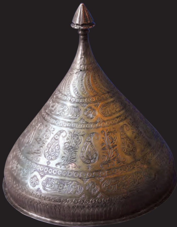
Diametri: 24 sm hündürlüyü: 26 sm XIX əsr EF 7121