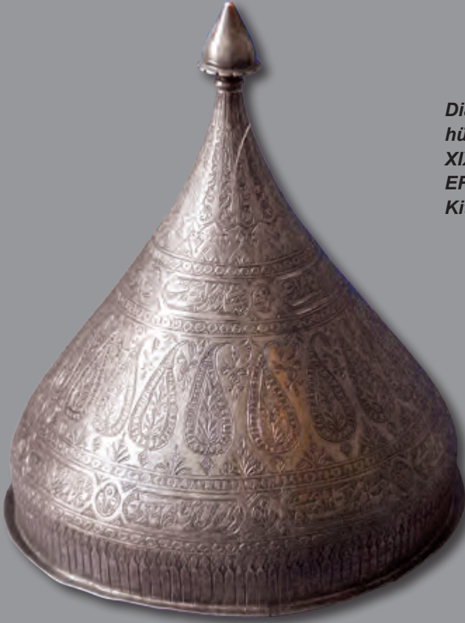
Diametri: 24 sm hündürlüyü: 28 sm XIX əsr EF 7372 Kitabə: Sədi Şirazinin qəzəlindən