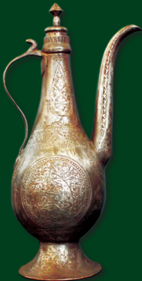
Hündürlüyü: 28 sm XIX əsr EF 2445

Güləbdanlar - məclis qabı kimi istifadə olunur. Güləb müalicəvi xüsusiyyətə malikdir. Xalq təbabətinə görə o ürəyi qüvvətləndirir, əhvali-ruhiyyəni yüksəldir, gözün nurunu artırır. Dini inanclara görə güləb axirət dünyasında peyğəmbərin yanında olmaq üçün vəsilə ola bilər. İslam düşüncəsinə görə qızılgül Məhəmməd peyğəmbərin üzünün nurundan yaranmış və peyğəmbərin simvolu hesab olunur. Ona görə də Orta əsrlər dövrü qəbirüstü abidələrində güləbdan təsvirləri geniş yer almışdır. Güləbdan təsvirləri divardan asılmaq üçün nəzərdə tutulmuş xalçalarda (EF1031, EF9055, EF8147, EF9392, EF6055, EF7910, EF7674) və namazlıqlarda (EF 5189), tikmələrdə (EF5202, EF5426), qələmkarlarda (EF2250, EF2851, EF2551, EF4780, EF5956), eyni zamanda mis qablar üzərində (xüsusən məcməyilərdə-EF2906, EF5496, EF5553, EF8878) qoruyucu kimi istifadə olunmuşdur. Məclis üçün nəzərdə tutulduğuna görə güləbdanların dekorativ tərtibatına ciddi fikir verilirdi.