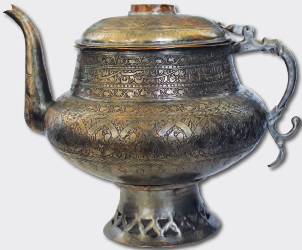
Səfər samovarı Hündürlüyü: 31 sm XIX əsr EF 9660