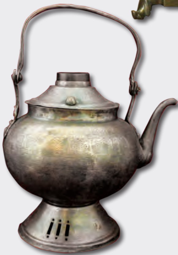
Səfər samovarı Hündürlüyü: 36 sm XIX əsr. EF 9588