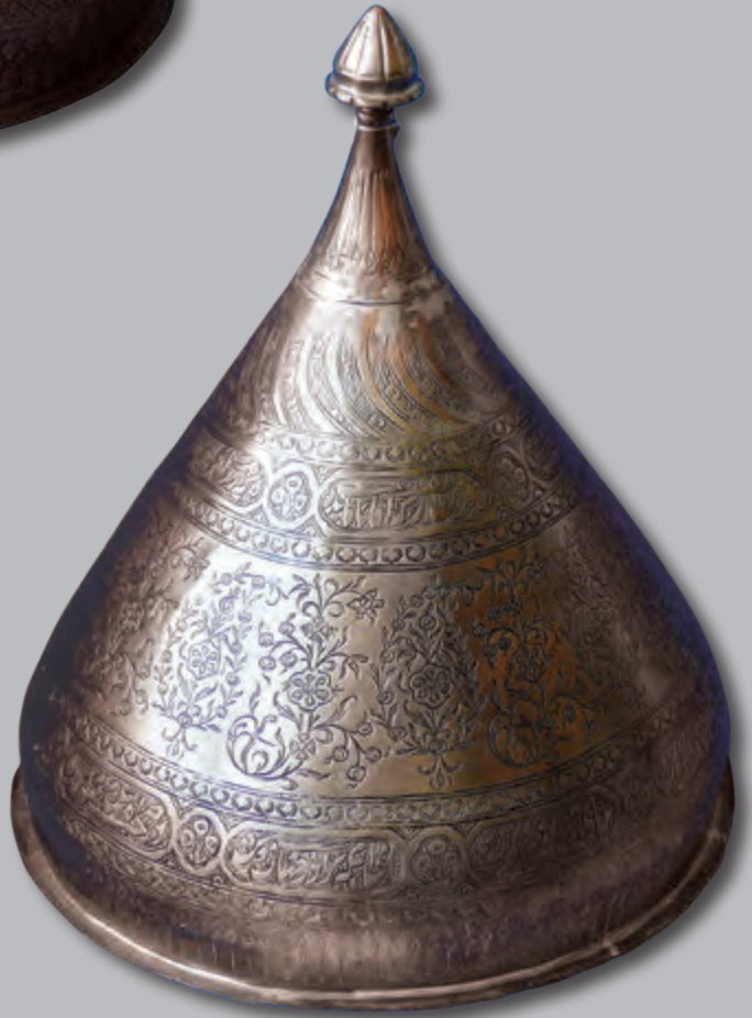
Diametri: 25,7 sm hündürlüyü: 30,5 sm XIX əsr EF 9624 Kitabə: Sədi Şirazinin qəzəllərindən