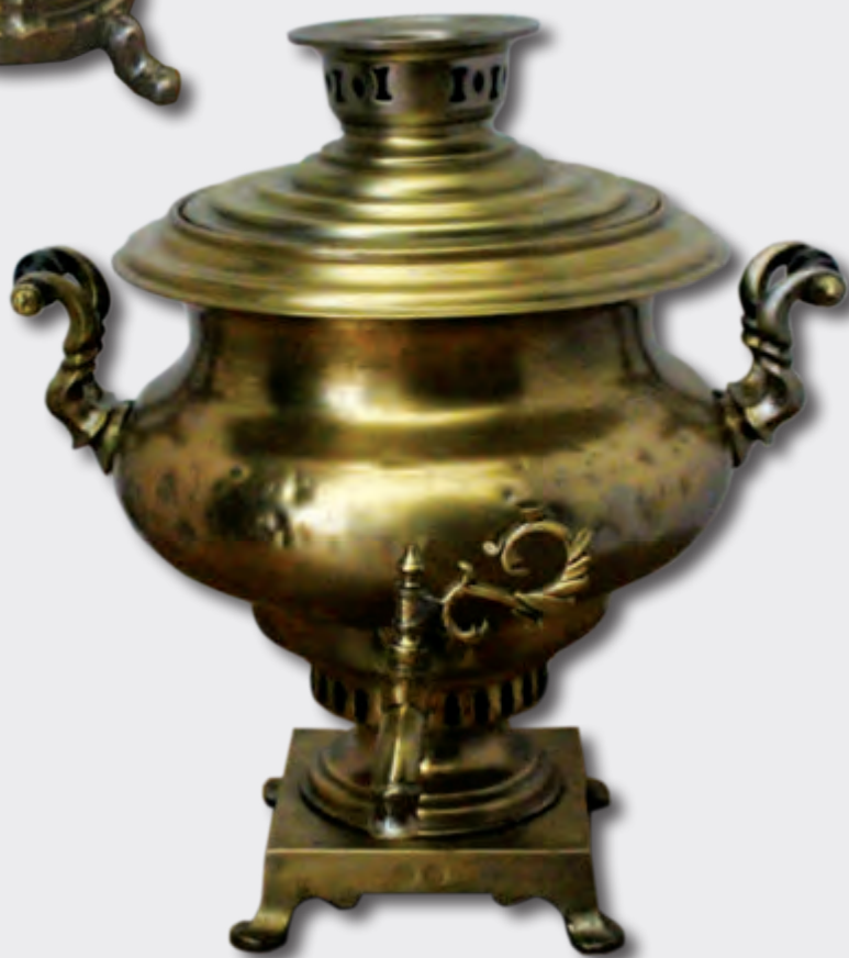
Samovar Hündürlüyü: 44 sm XIX sər. Rusiya EF 6912