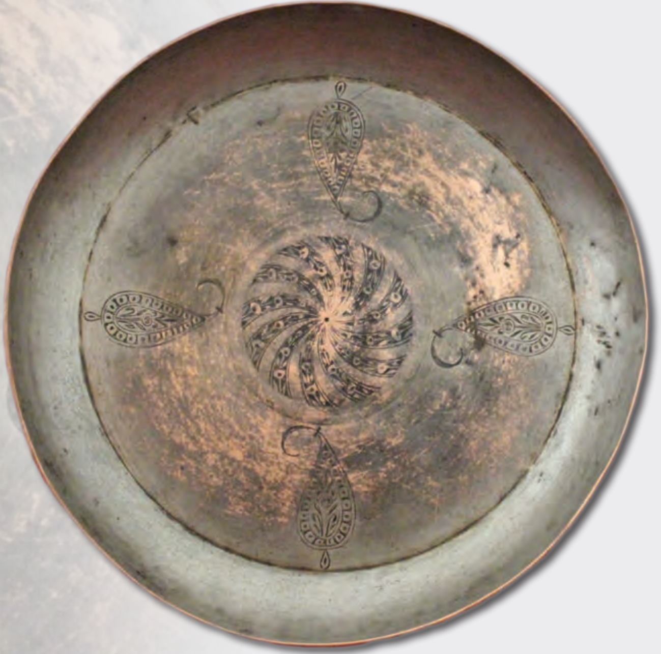
Ağzının dm: 26 sm oturacağıının dm: 18 sm dərinliyi: 3 sm XIX əsr EF1701 Kitabə: Sahibi Zeynalabidin