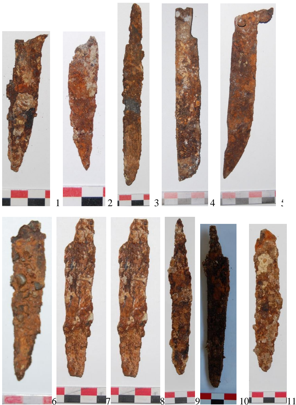
Tablo I. Dəmir bıçaqlar.