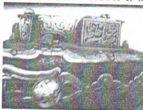
Şəkil 4. SBF 117

SBF 178 sayılı tapança zəngin bədii işləməsinə görə seçilir (ümumi uzun.52 sm., lülənin diam. 03 sm., qundağının eni 04 sm.). Tapançanın lülə və qundağının üzəri qarasavadla nəbati naxışlanmışdır. Onun xəzinə və çaxmaq hissəsində qızıl su ilə sahibinin, ustanın adı və istehsal tarixi həkk