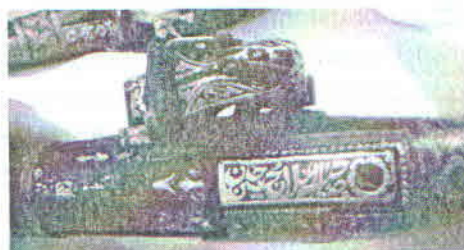
Şəkil 6. SBF 2795

Beləliklə belə nəticəyə gəlmək olar ki, Azərbaycanın çoxsaylı orta əsr maddi mədəniyyət nümunələri, o çümlədən, silah- lar üzərində dekorativ elementli müxtəlif epiqrafik yazılar ilə yanaşı, həndəsi və nəbati naxışların üstünlük təşkil etdiyi aydın hiss olunur. Canlı aləmin təsvirinə işə nümunələr üzərində nadir hallarda təsadüf