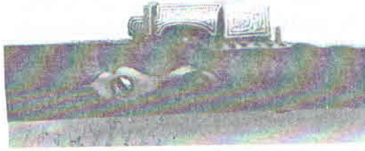
Şəkil 2. SBF 108

Tüfəngin xəzinə hissəsində isə qızılı su ilə kitabə nəsx xəttilə ərəb dilində yazılmışdır: ۱۱۲۹ / توكلت الله - "Təvəkkül Allaha/ 1129=1716/17-ci il".