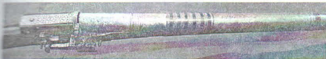
Şəkil 1. SBF 104'

Tüfənglər: SBF 104 sayılı tüfəng (ümumi uzun. 1.0 m. 39 sm., lülənin diam. 3.05 sm., qundağının eni 07 sm.) əsasən taxta və metaldan hazırlanmışdır. Tüfəngin qundağının üzəri işə yaşıl və sarı rəngli sümükdən inkrustasiya olunmuşdur. Tüfəngin metaldan hazırlanmış çaxmaq və xəzinənin üzəri gözəl qızılı su ilə nəbati və həndəsi naxışlanmışdır. Tüfəngin lüləsi qara və sarı rəngin vəhdətini təşkil edən nəbati naxışlarla bəzədilmiş və tuğraya bənzər haşiyənin içində, qızılı su ilə nəbati təsvirlər və tarix haqq olunmuşdur: ۱۱۲۰ - “1120”=1707/08-ci il (şəkil 1).