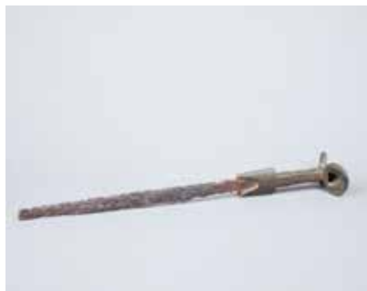
Tunc dəstəli, dəmir tiyəli yəhərvari qılınc. Uzuntəpə