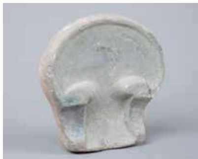
Azıx adamının çəna sümüyü