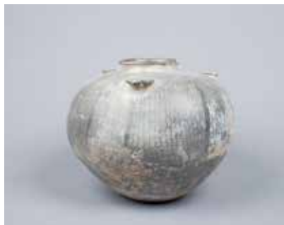
Saxsı yastı qulplu qab. Mingəçevir