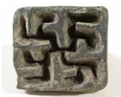
Gil pintader. Sarıtəpə