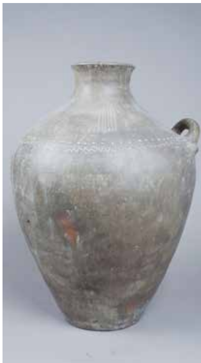
Saxsı nehrə. Daşsalahlı