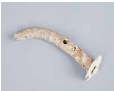
Sümük qaytarğan hissəsi. Mİngəçevir