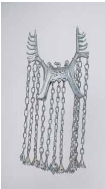
Tunc asma. Dolanlar