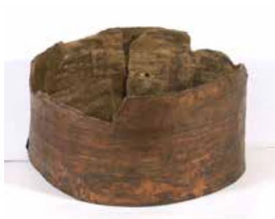
Tunc kəmə. Qazax