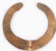
Tunc bəzək əşyası. Mingəçevir