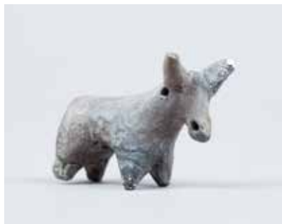
Gil heyvan fiquru. I Kültəpə