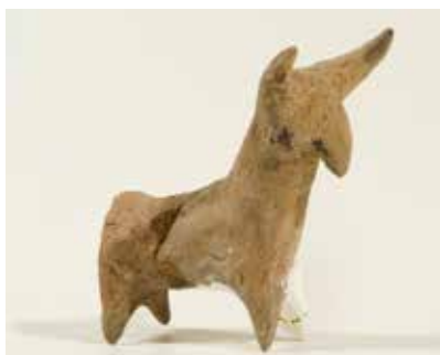
Gil heyvan fiquru. I Küləpə