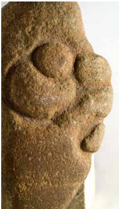
Dəvəgözüündən bıçaqvari lövhələr. I Kültəpə