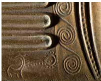
Tunc qılınc. Mingəçevır