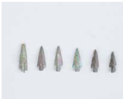
Tunc skif tipli ox ucları. Mingəçevir