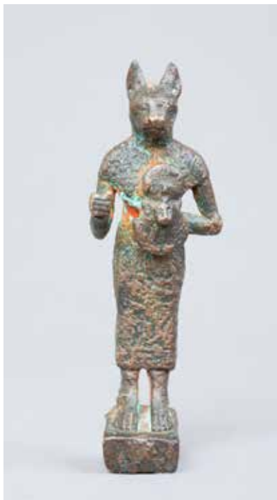
Tunc Bast heykəlciyi. Gəncə