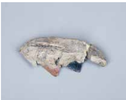
Sümük quraşdırma oraq. Şomutəpə