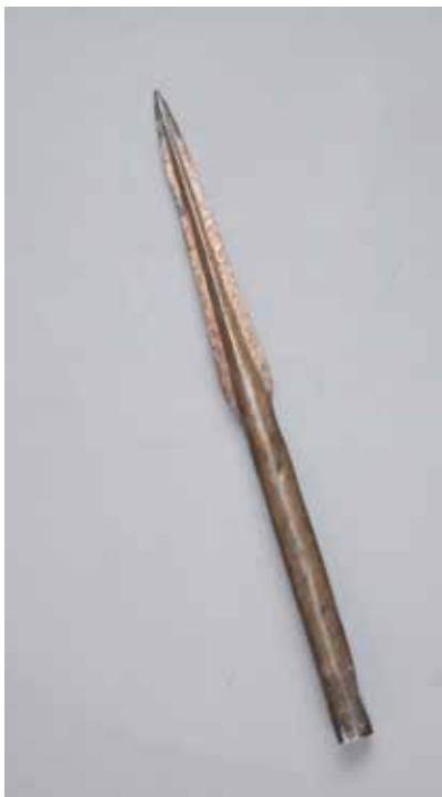
Tunc nizə ucluğu. Mingəçevir