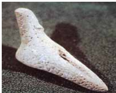
Gil qadın heykəlciyi. Qarğalartəpəsi