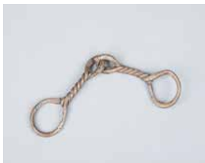
Tunc gəm. Mingəçevir