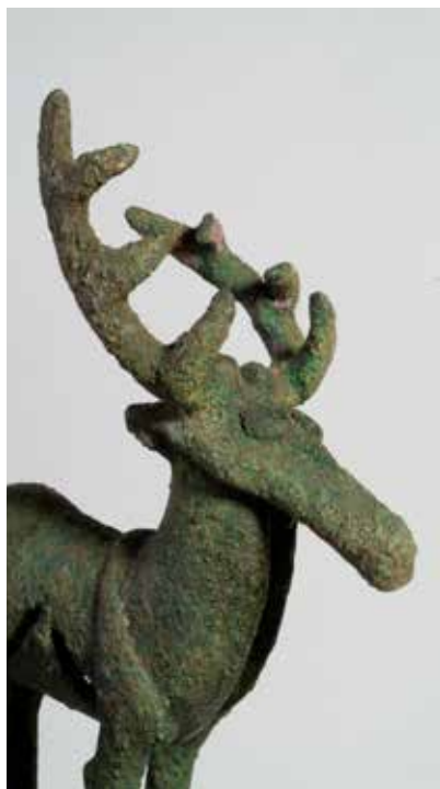
Tunc maralşəkilli bayraq başlığı. Qaracəmirlilər