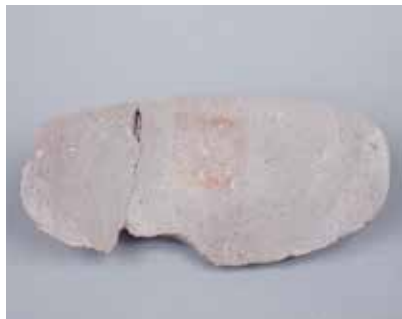
Qayıqvari dən daşı. I Kültəpə