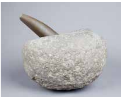
Daş həvəngdəstə. I Kültəpə