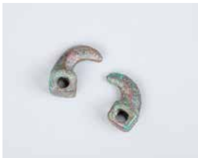
Tunc qaytarğan hissəsi. Mingəçevır