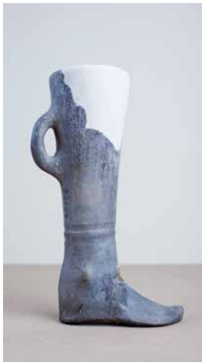
Saxsı ayaqqabıformalı qab. Mingəçevir