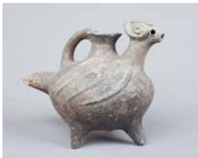
Saxsı zoomorf qab. Mollaməhərrəmli