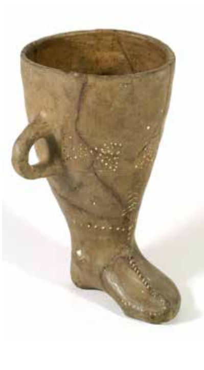
Saxsı ayaqqabıformalı qab. Mingəçevir