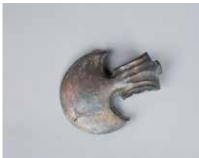
Tunc təbərzin balta. Mingəçevir