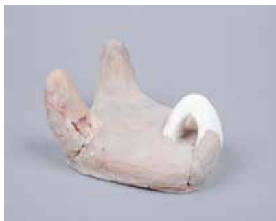
Ocaq qurğusu. I Küləpə