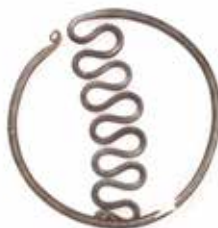
Tunc bəzək əşyası. Mingəçevir