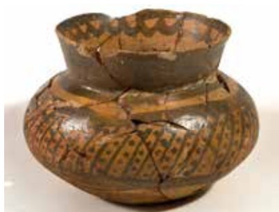
Xələf tipli boyalı saxsı qab. I Kültəpə