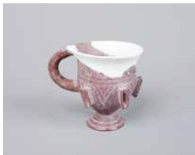
Tuf qab. Mingəçevir