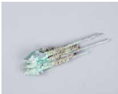
Tunc ox ucları. Mingəçevir