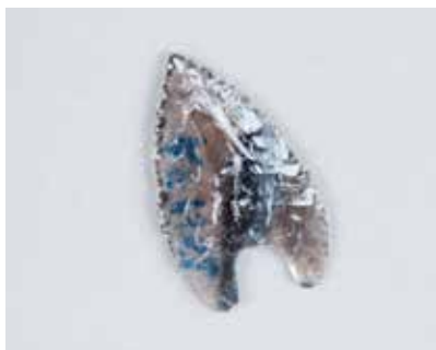
Dəvəgözündən ox ucu