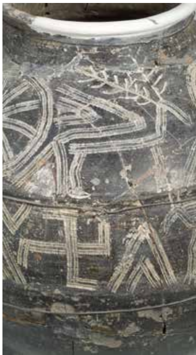
Saxsı təsvirli qab. Qaracəmirlı