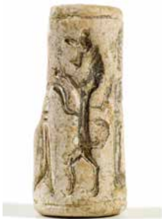
Urartu tipli möhür. Xarabagilan