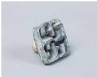
Gil pintader. Sarıtəpə