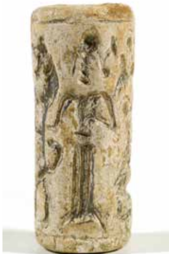
Urartu tipli möhür. Xarabagilan