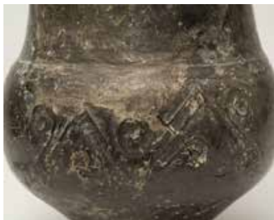
Təsvirli saxsı qab. Babadərviş