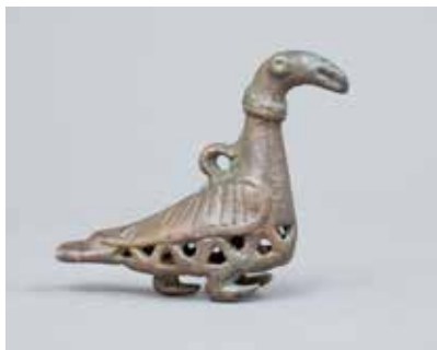
Tunc bəzək əşyası. Xaçbulaq