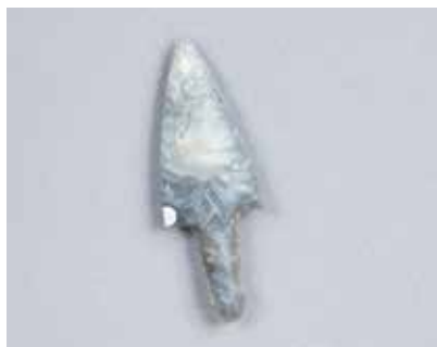
Çaxmaqdaşından ox ucu