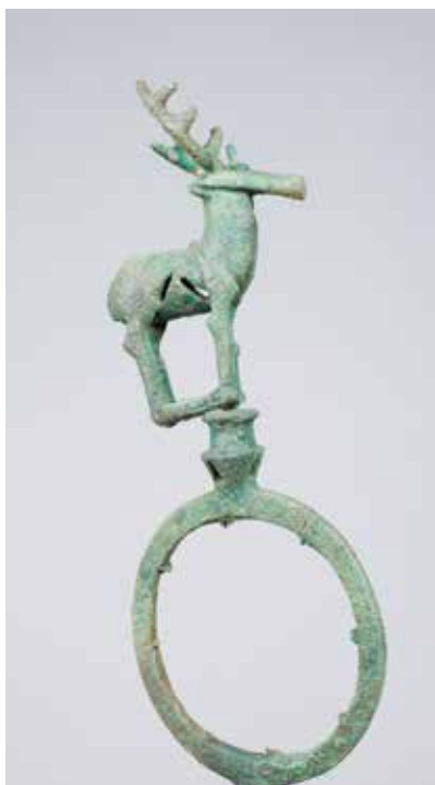
Tunc maraşəkıllı bayraq başlığı. Qaracəmırlı