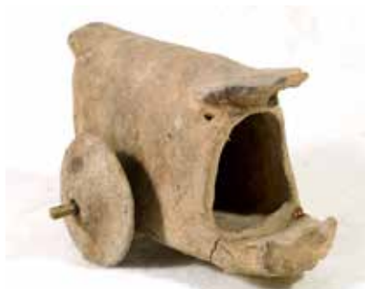
Gil araba modeli. Mingəçevir