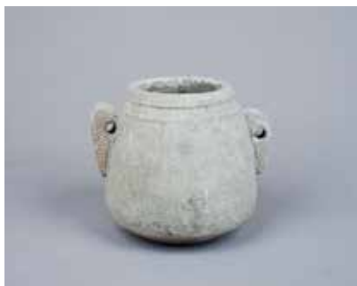
Daş qab. Ağdam