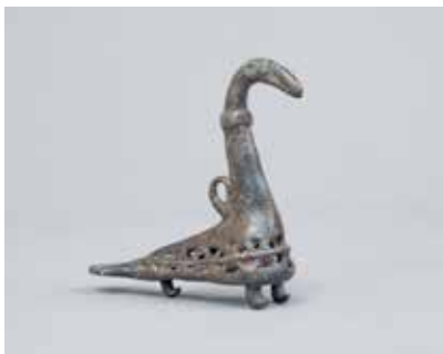
Tunc bəzək əşyası. Xaçbulaq