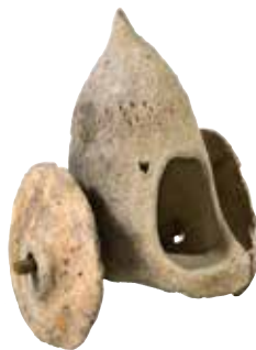
Gil araba modeli. Mingəçevir