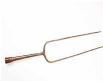
Tunc yaba. Xaçbulaq