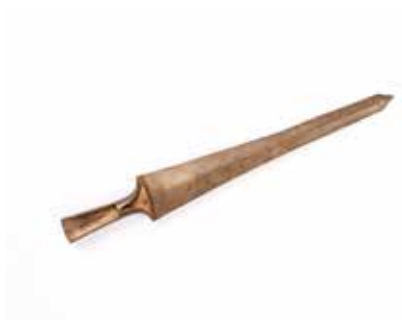
Tunc xəncər. Mingəçevir