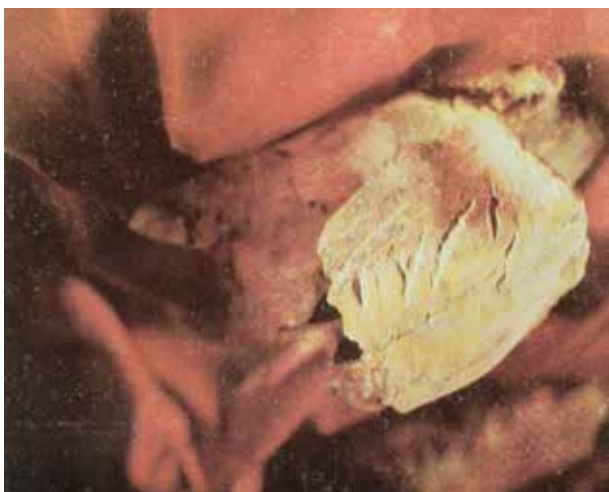
Üzərində cızma olan ayı kəlləsi. Azıx mağarası