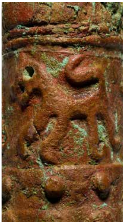
Tunc əsa başlığı. Mingəçevir