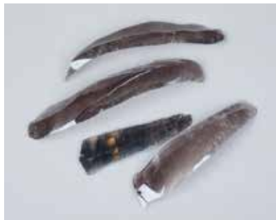
Dəvəgözündən bıçaqvari lövhələr. I Kültəpə