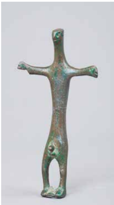
Tunc antropomorf fiqur. İbrahimhacılı