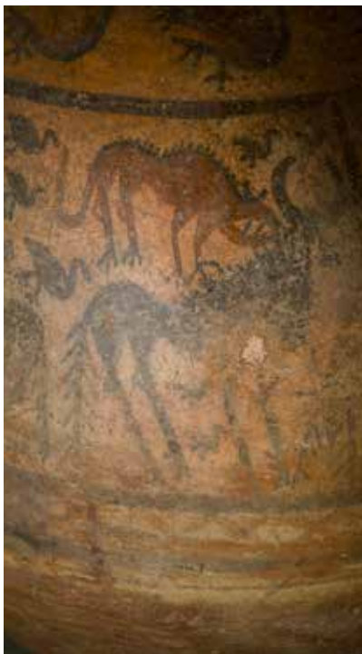
Boyalı, təsvirli saxsı qab. Şahtaxı