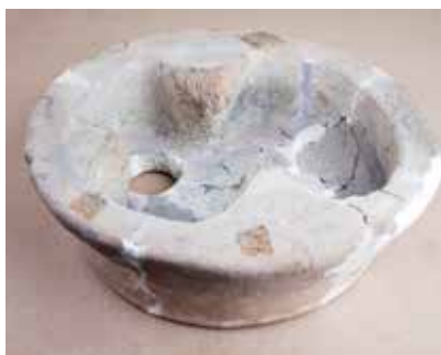
Ocaq qurğusu. I Küləpə