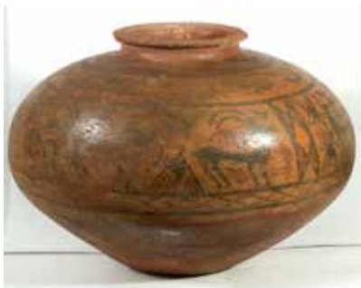
Boyalı, təsvirli saxsı qab. Şahtaxı