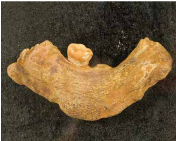
Azıx adamının çənə sümüyü