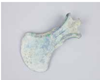
Davəgözündən bıçaqvari lövhələr. I Kültəpə