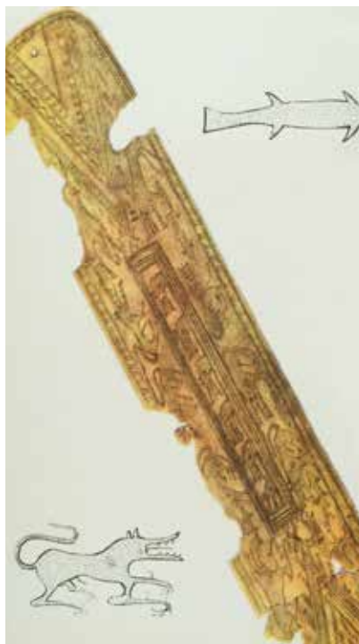
Tunc kəmər. Qazax