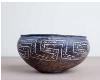
Saxsı təsvirli qab. Göygöl