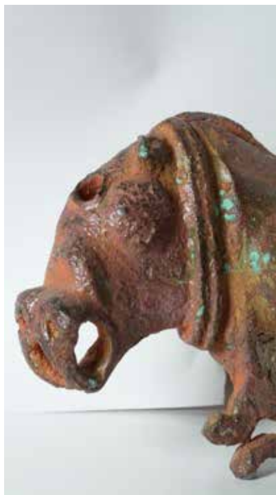
Tunc gəm. Qaracəmirlı