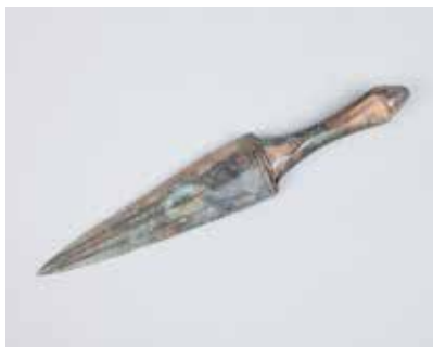
Tunc xəncər. Xaçbulaq