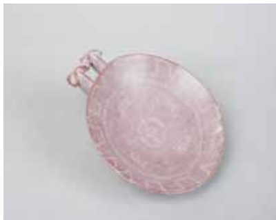
Tuf qab. Mingəçevir