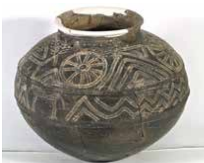
Saxsı təsvirli qab. Qaracəmirli