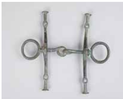
Tunc gəm. Mingəçevir