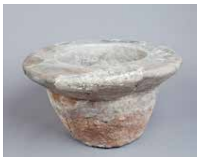
Ocaq qurğusu. I Küləpə