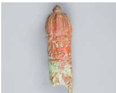
Tunc əsa başlığı. Mingəçevir