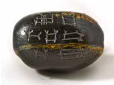
Mixi yazılı muncuq. Xocalı. Əsli Dövlət Ermitajındadır