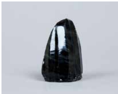
Dəvəgözü nukleus. I Kültəpə