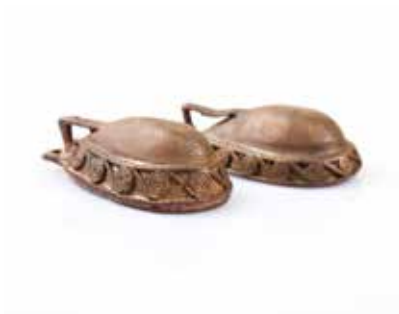
Tunc bəzək əşyası. Xaçbulaq