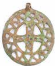
Tunc bəzək əşyası. Xaçbulaq