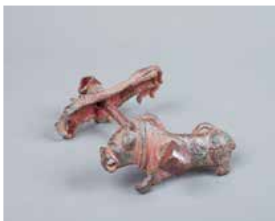
Tunc gəm. Qaracəmirlı