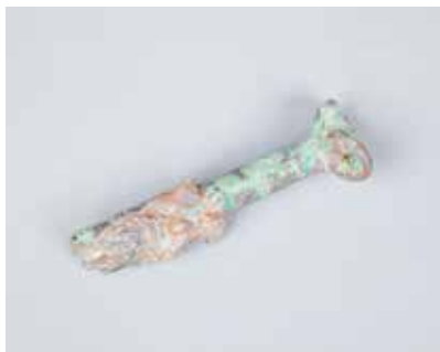
Tunc dəstəli, dəmir tiyəli yəhərvari qılınc. Xəzər dənizi