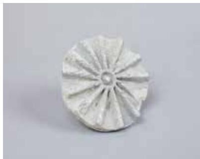
Gil pintader. Sarıtəpə