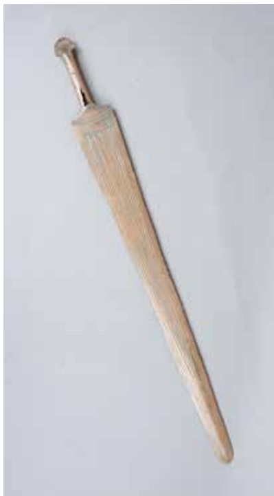
Tunc qılınc. Mingəçevır