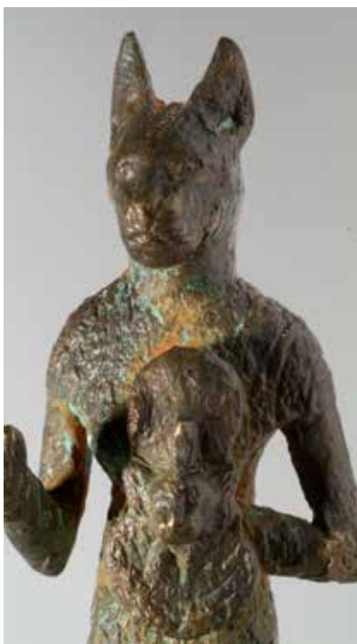
Tunc Bast heykəlciyi