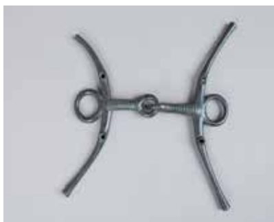
Tunc gəm. Dolanlar