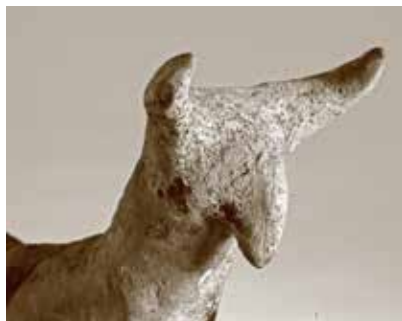
Gil heyvan fiquru. I Kültəpə