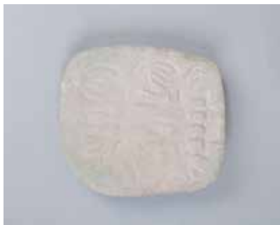
Üzərində cızma olan ayı kəlləsi. Azıx mağarası