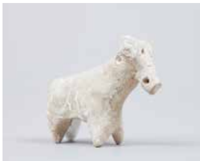
Gil heyvan fiquru. I Kültəpə