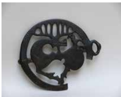
Tunc toqqa başlığı. Nərgizava