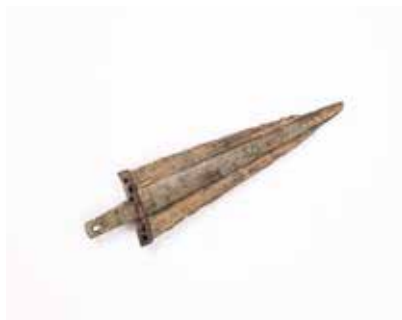
Tunc xəncər. Mingəçevir