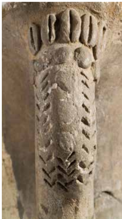
Saxsı qabın buğda təsvirli qulpu. Xocalı