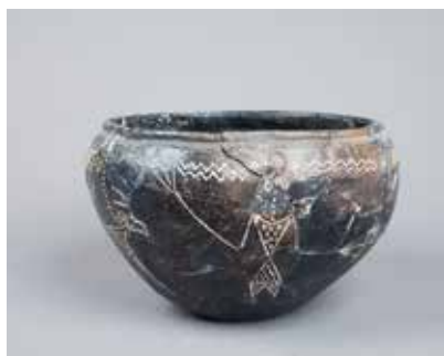
Saxsı təsvirli qab. Göygöl