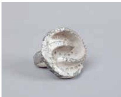
Gil pintader. Sarıtəpə