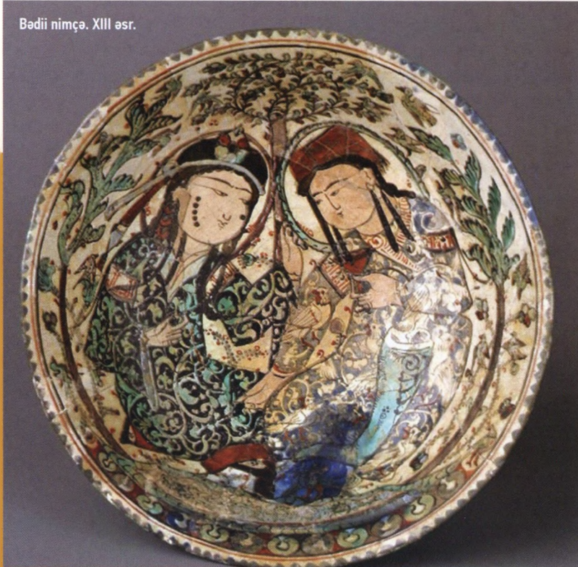
Bədii niçmə. XIII əsr.

Əgər avropalıların miniatür anlamına aydınlıq