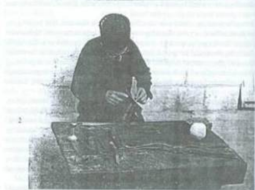
XXVIII tablo. Sarsac alet ve lüzumları: 1—Örmək alətləri: çəkic, dözgə, çarxək, qazan, iynə, lüz, saxək, sünbək, çəkic, kəllətın, cılor spayn, ip yamaq, qabaq; 2—Sarsac idarəkar.