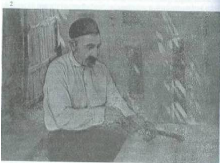
XIV tablo. 1 - Xarrat dazgahı; 2 - Cörcənin iyri vasitəsilə yonulması.