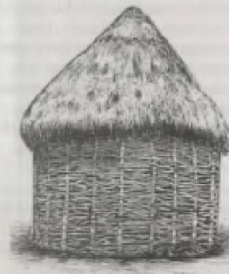
Dairəvi çubuqhörmə evi.

Yaşayış məskənlərinin tip və formalarının bərqərar olmasında Azərbaycan üçün səciyyəvi olan əkinçilik, əkinçilik-maldarlıq və maldarlıq kimi təsərrüfat-mədəni tiplərin mühüm rolu olmuşdur. Azərbaycan ərazisi üzrə məskunlaşma məhz bu təsərrüfat-mədəni tiplərə uyğun gəlir. Naxçıvan, Gəncə-Qazax, Şirvan, Alazan-Hafləran, Mil-Muğan, Qarabağ, Lənkəran, Şabran düzənlikləri suvarma əkinçiliyi üçün əlverişli olduğundan, əhalinin məskunlaşmasında başlıca rol oynamışdır. Burada məskunlaşma, əsasən,