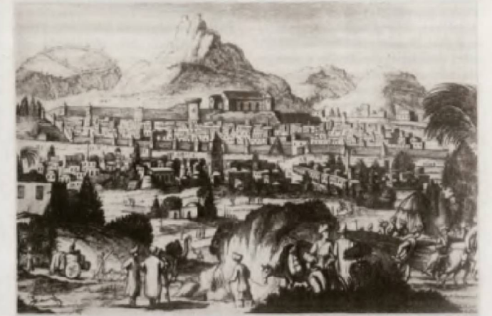
Şamaxı şəhəri. 17 əsr. Adam Olearinin rəsmi.

Azərbaycanlıların yaşayış məskənlərinin tarixən yaranmış digər sosial-iqtisadi tipləri oba, şenlik, binə, yurd, düşərgə, qışlaq, yaylaq, dəkkə, dəngə, sı-