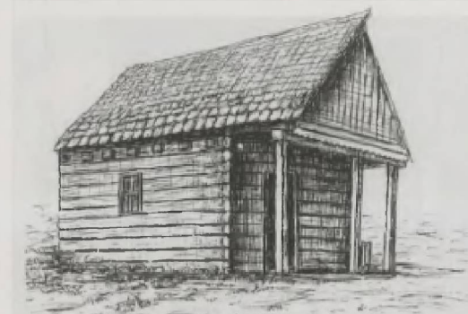
Kartma tipli ev.

19 əsr-20 əsrin əvvəllərində Azərbaycan meşə massivləri ilə zəngin olan bölgələrində ağacdan tikilmiş müxtəlif