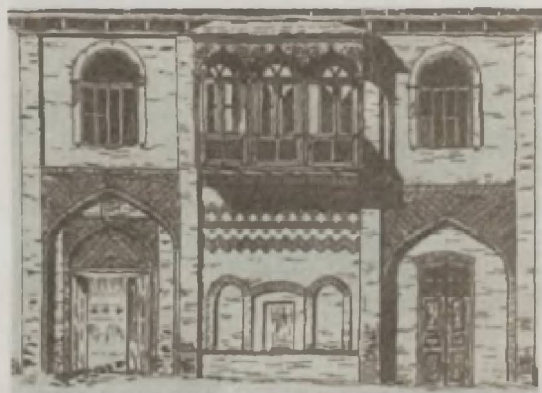
Qubada yaşayış evi, 19 əsr.

müxtəlif adlarla məlum olmuşdur. Şəki–Zaqatala bölgəsində “çığ ev”, “ağac ev”, “ajan ev”, “dəyə”, “dirəkarası”, Lənkəran bölgəsində “sünnəkə” və ya “südü-nəkə”, “puştalı ev”, “qoyməkə”, “carciv ev”, Şirvan bölgəsində “bağdadi ev”, Qərb bölgəsində “mərkək”, “dirəkarası və aradoldurma” adlanan cımğa evlər memarlıq-kompozisiya quruluşuna görə bir və ya ikimərtəbəli, tək və qoşa otaqlı, eyvanlı və eyvansız inşa olunurdu.