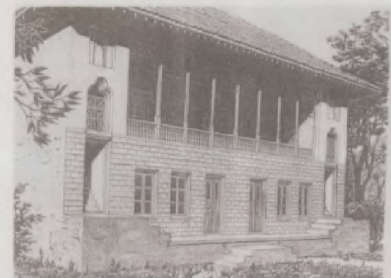
Imarət, 19 əsr.

Üzərinə müxtəlif mətbəx avadanlığı yığılmış raf (zeh, ləmə) evin daxili sahmanında mühüm yer tuturdu. Onu, bir qayda olaraq, evin yan divarları boyunca düzəldirdilər. Bəzən evin bütün divarları boyu düzələn zehə də təsadüf olunurdu. Zehin üzərinə məişətdə az işlədilan və tez sinən ev avadanlığı müəyyən ardıcılıqla və xüsusi zövq ilə yığılırdı. Zeh bir növ ailənin iqtisadi vəziyyətinin göstəricisi idi. Buraya düzəlmüş qabların sayına, dəyərinə və müxtəlliyinə görə ailə sahibinin maddi vəziyyəti müəyyən etmək olardı.