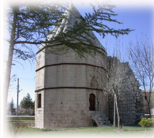
Şəkil 5. Əlləddin bəy türbəsi