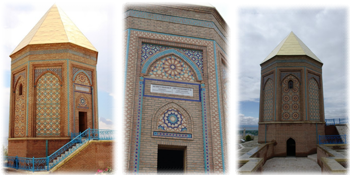
Şəkil 3. Nuh peyğəmbərin məzarüstü türbəsi (VIII-XII əsr)

Nuh Peyğəmbər türbəsi - Elmi araşdırmalar nəticəsində Nuh peyğəmbərin məzarüstü türbəsinin yeri təyin olunub, aparılan arxeoloji qazıntı zamanı türbənin özülü, naxış elementləri tapılaraq bərpa işlərinə başlanılıb. Türbə Yusif Küseyir türbəsində olduğu kimi sərdabədən, yerüstü məqbərədən və konusvari örtükdən ibarətdir. Bərpa zamanı kərpic, kaşı və müxtəlif naxış elementlərindən istifadə edilib. Bu türbədədə kərpic materialından istifadə olunub. [1]( Şəkil 3 )