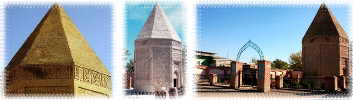
Şəkil 1. Yusif Küseyir oğlu türbəsi (yeni foto)

Naxçıvan memarlıq məktəbinin ilkin nümunələrindən olan, Möminə Xatun türbəsindən 25 il əvvəl yəni 1162-ci ildə inşa edilən, əsil adı Yusif Küseyir oğlu türbəsi olan, el arasında isə Ata –baba türbəsi və ya Ata-baba günbəzi adlandırılan bu abidə, Azərbaycanın qülləvari türbələri içərisində üst piramidal örtüyü 800 ildən artıq bir müddətdə salamat qalan yeganə abidə sayılır.