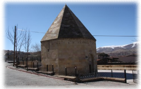
Şəkil 9. Əmir Kəmarətdin türbəsi

Nəticə: Türkiyədə Əlləddin bəy, İbrahim bəy, Əmir Kəmarətdin türbəsi, Ahı Yusif türbəsi, Sitte Məlik (Şahinşah) gumbəzi, Qaya Xəlil Əfəndi və Naib bəy türbələrinin Yusif Kuseyir oğlu türbəsi ilə həm oxşar həm də fərqli cəhətləri var.