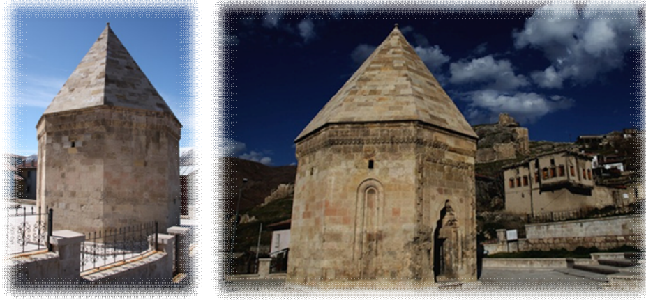
Şəkil 7. Sitte Məlik (Şahinşah) gumbəzi

qapı üzərində bitki elementlərindən istifadə olunaraq çərçivələnmişdir. Fasad üzərində olan ornamentlər daha sadəliyi ilə seçilir. Bitki mənşəli gül elementləri yalnız fasadın giriş hissəsində mövcuddur. [3]