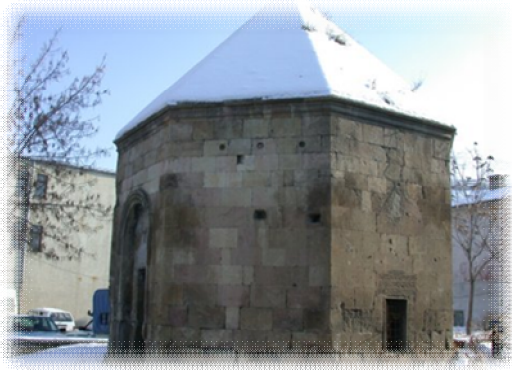
Şəkil 8. Naib bəytürbəsi