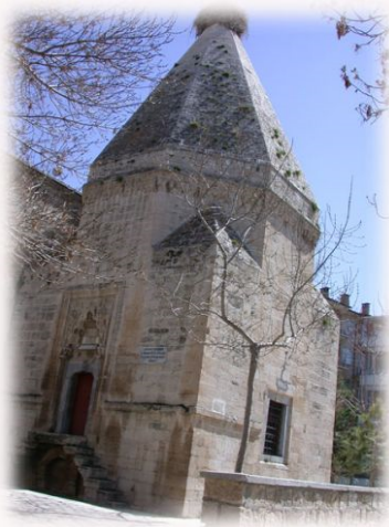
Şəkil 4. İbrahim bəy türbəsi

Türkiyənin Karamanının Hisar, İmarət məhəllələrində yerləşən İbrahim bəy (Şəkil 4) (Bu türbə məscidə bitişik formadadır), Əlləddin bəy (Şəkil 5) (Fasaddan 8 guşəli olsa da, daxildən kub şəkillidir), Qaya Xəlil Əfəndi (Şəkil 6) (1409-cu ildə tikilmişdir, Sitte Məlik (Şahinşah) günbəzi (Şəkil 7) (1196-cı il, memarı Tut Bəğ Bəhram oğlu, Seyfəddin Suleyman oğlu Şahinah tərəfindən tikilmişdir), Naib bəy türbəsi (Şəkil 8) (1291-ci ildə Naib Əşrəf tərəfindən tikilmişdir, bir mərtəbəlidir), Ahı Yusif türbəsi (1986-cı ildə tikilmiş, kitabədə Qurani Kərimin 88-ci surəsinin ayətinin sonu yazılmışdır) və Əmir Kəmarətdin türbəsinin (Şəkil 9) (1196-cı ildə tikilmiş, içərisində 3 naməlum başdaşı var, Qəriblər məzarlığının mərkəzində yerləşir. Qeyd etmək lazımdır ki, Məmmədəmin Rəsulzadənin qəbri bu məzarlıqdadır.) hər biri Yusif Küseyir türbəsində olduğu kimi, tikilidə sərdabədən ibarət olaraq, giriş hissədə kitabə mövcuddur, 8 guşəlidir və konusvari örtükdən ibarətdir. [2]