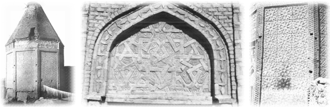
Şəkil 2. Yusif Küseyir oğlu türbəsi (1968-ci il)

Türbənin üzərindəki kitabədə belə bildirilmişdir: