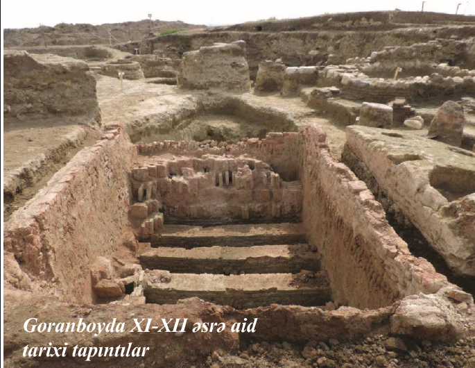
Goranboyda XI-XII əsrə aid tarixi tapıntılar

formadan fərqli olaraq, nisbətən son tarixi dövrlərin məhsuludur. Bunlar kəndlərin inkişafındakı son mərhələni təşkil edirlər. Belə kəndlərdə məhəllələr bir neçə nəsilədən ibarət olur. Bu nəsilər öz növbəsində, bir-biri ilə sıx qonşuluq münasibətlərinə girərək yığcam vəziyyətdə yerləşirlər. Bu, hər şeydən əvvəl, yarımoturaq maldar tayfaların tamam oturaqlaşması və əkinçilik təsərrüfatına keçmələri ilə əlaqədar olmuşdur. Əkinçiliyin inkişafı ilə vəziyyət tədricən dəyişmiş və hər bir ayrıca nəsil başqa nəsilərlə sıx iqtisadi qonşuluq münasibətləri yaratmışdır” [7, səh. 116]. Etnoqrafın bu fikirlərini tədqiq etdiyimiz bölgənin də yığcam kənd formasının yaranması prosesinə şamil etmək olar. Goranboyun Borsunlu, Faxralı, Rəhimli, Yevlaxın Gülövşə, Əkşəm, Hacıselli, Malbinəsi, Qoyunbinəsi və b. kəndləri yığcam kənd formasına aid edilir.