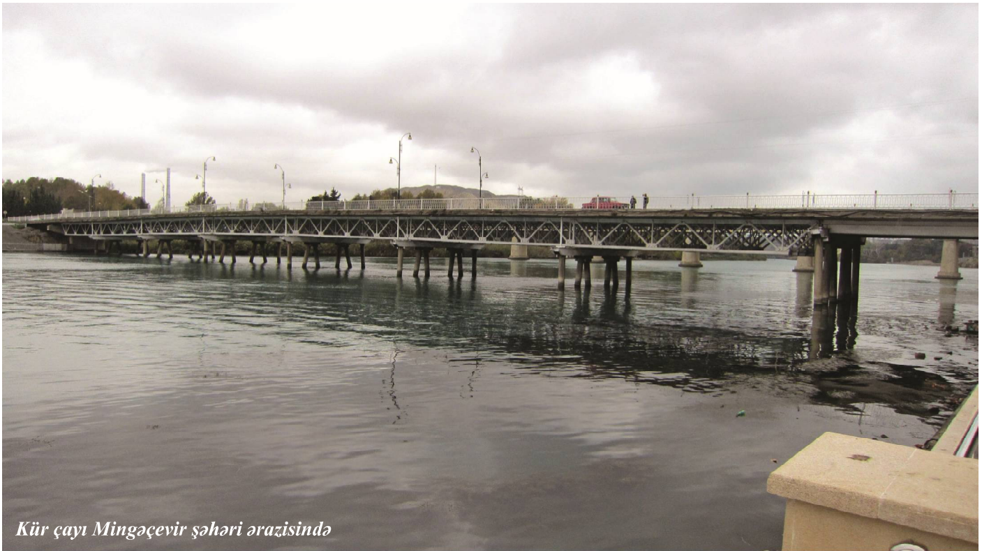
Kür çayı Mingəçevir şəhəri ərazisində

AYGÜN QƏDİROVA AMEA Arxeologiya və Etnoqrafiya İnstitutu