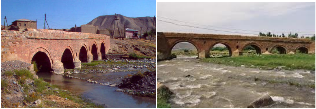
Aza körpüsü. Orta əsrlər. Ordubad rayonu

edilmişdir. Buradan keçən ticarət karvanları ilə yerli məhsullar, o cümlədən quru meyvələr, sənətkarlıq məhsulları, ipək ixrac olunurdu. Baş verən təbii fəlakətlər və bəzi tarixi hadisələr nəticəsində dəfələrlə dağılmış, sonralar təmir edilmişdir. Güclü sel suları körpünün bir hissəsi yuyulub dağıldığından 1997-ci ildə əsaslı şəkildə bərpa olunmuş və yenidən qurulmuşdur. Hazırda Naxçıvandan və Ordubaddan Azakəndə gedən əhali və nəqliyyat vasitələri bu körpüdən istifadə edir.