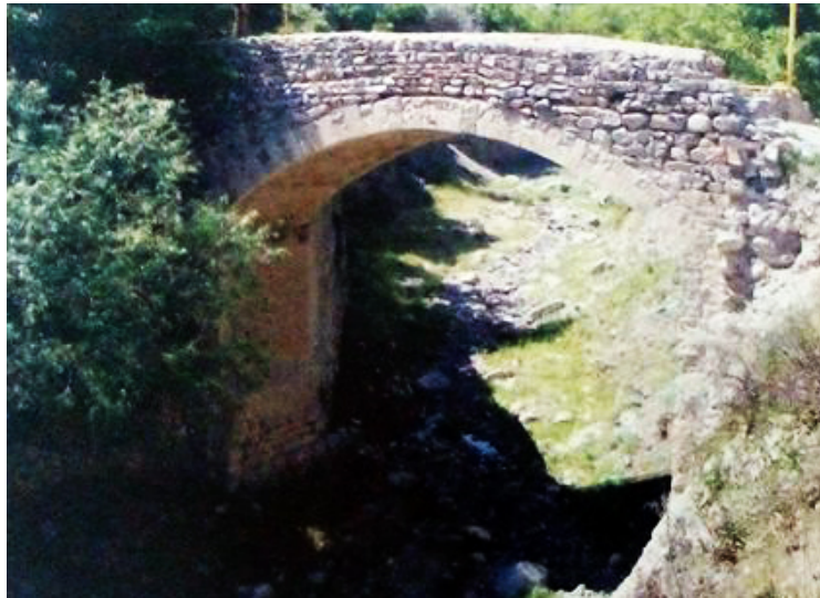
Yuxarı Əylis körpüsü III

Yuxarı Əylis körpüsü III - XVIII-XIX əsrlərə aid edilən, uzunluğu 9 m, eni 3.2 m olan bu körpü kəndin içərisindəki dərənin üzərindən keçmək üçün nəzərdə tutulmuşdu. Birtağlıdır. Tağın kənarları yonulmuş daşlarla bəzədilmişdir.