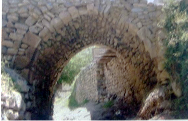
Yuxarı Əylis körpüsü II

olunaraq “Xoşkeşin” və ya “İşkeşin” şəklində işlədilir. Ağ rəngli dağ daşından inşa edilmiş, orta əsrlərdə Ordubad, Əndəmic, Əylis istiqamətində hərəkət edən ticarət karvaları bu körpüdən keçərək Əylis bazarına daxil olmuşdur.