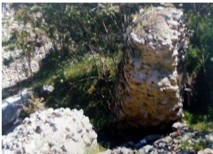
Yuxarı Əylis köpüsü I

Yuxarı Əylis köpüsü I - XVI əsr, Yuxarı Əyis kəndində yerləşən abidənin qalıqları kəndin içərisindən keçən Əylis çayının içərisindədir. Körpünün bir aşırımın qalıqları qalmış, dayaq sütunu və tağın bir qismi qaya daşlarındadır. Əhəng məhlulu istifadə olunmaqla inşa edilmiş, xalq arasında Şah Abbasın köpüsü adlanır.