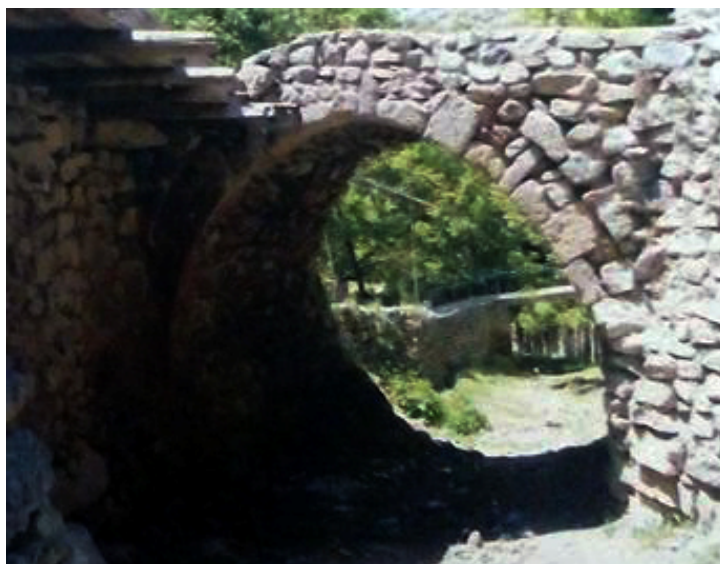
Yuxarı Əylis körpüsü IV

Ələhi körpüsü - XVIII-XIX əsrlərə aid, Ələhli çayın üzərində, uzunluğu 30 m, eni 3 m, hündürlüyü 6.5 m olan, ikişırımlı, çatmatağlı, qaba şəkildə yonulmuş boz dağın başında inşa edilmişdir. Körpünün qərb oturacağı qaya üzərində oturulmuşdur.