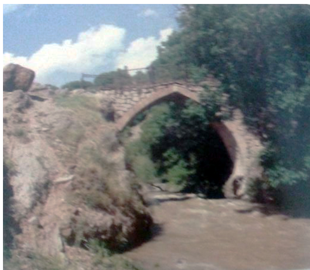
Bist köpüsü II

Yuxarı Əylis köpüsü I - XVI əsr, Yuxarı Əyis kəndində yerləşən abidənin qalıqları kəndin içərisindən keçən Əylis çayının içərisindədir. Körpünün bir aşırımın qalıqları qalmış, dayaq sütunu və tağın bir qismi qaya daşlarındadır. Əhəng məhlulu istifadə olunmaqla inşa edilmiş, xalq arasında Şah Abbasın köpüsü adlanır.