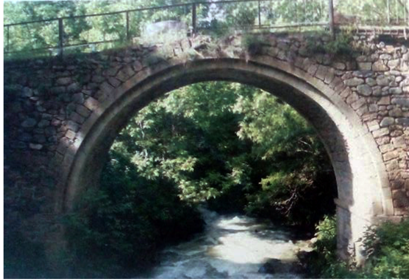
Bist körpüsü I

Bist körpüsü I - Bist kəndinin qərb tərəfindən axan Ələhi çayı üzərində yerləşən tarix abidəsi XVII əsrə aid edilir. Daş və kərpicdən tikilmiş, iki tağlı körpünün eni 3.8 m , uzunluğu 21 m, hündürlüyü 10 m-dir. Kəndə gediş-gəlişi təmin etmək, Böyük İpək yolunun qolları ilə hərəkət edən ticarət karvanlarına xidmət edən körpünün yanları dəmirlə əhatə olunmuşdur. Əvvəllər körpünün yanları iris al daşlarla möhkəmləndirilmiş, I-ci Şah Abbasın dövründə tikilməsi haqda məlumatlar da var.