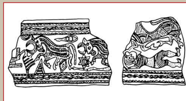
Бронзовый пояс из некрополя Ходжалы

Как отмечено выше, бронзовые пояса известны также из других синхронных памятников как Азербайджана, так и сопредельных регионов Кавказа 12 . Аналогичные пояса были найдены в Украине, в могильнике Подгорцы 13 . Исследованию кавказских поясов посвящен ряд работ, из которых ученые выделяют труды Р.Вирхова 14 , Б.В.Фармаковского 15 , а из отечественных - работы Дж.Халилова 16 . Именно последний впервые систематизировал известные ему пояса, высказав важные суждения по поводу их художественной и иной ценности. При этом он настаивает на местном происхождении этих поясов 17 . Несмотря на некоторые различия, их объединяет много общего, а изображения на них отражают как реальную жизнь, так и мифические сюжеты. В некоторых сюжетах ясно прослеживается влияние переднеазиатских мифических элементов - фантастические животные, борьба человека с хищниками, но это естественно, если учесть, что Азербайджан является частью переднеазиатского мира.