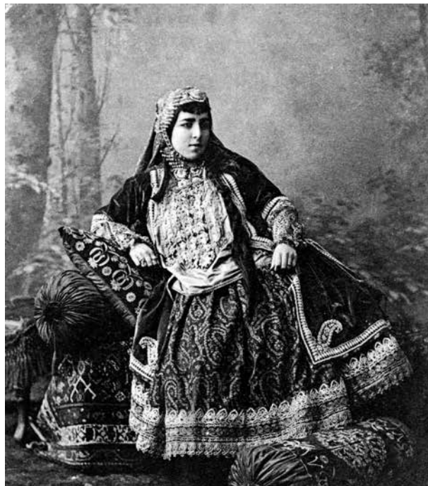
Нахчыванская бекша. XIX в.

и т.д. Как правило, чадру шили из гладкой материи черного и темно-синего цвета, а женщины из богатых семей покупали нарядные шелковые покрывала ярких тонов. В Иране и Афганистане подобные покрывала бытуют по сей день (9, с.117), отличаясь от чадры размером и способом ношения.