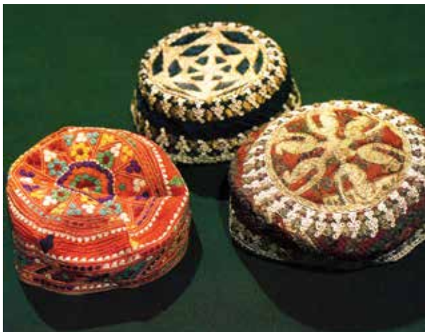
Арагчыны. НМИА. XIX в.

разлуки (если птицы смотрят в разные стороны).