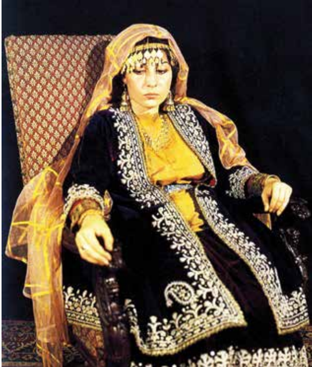
Традиционное праздничное одеяние знатной женщины из Нахчывана. НМИА. XIX в.

дов, которые не только не отказывались от него, а напротив, нашли ему новое применение, нося в виде шарфов, шалей, элементов вечерних нарядов. Нынешние модницы с удовольствием носят келагаи и в XXI веке, оставаясь все теми же загадочными восточными красавицами». На заседании межправительственного комитета по нематериальному культурному наследию ЮНЕСКО азербайджанское искусство келагаи под названием «Символизм и традиционное искусство келагаи» было включено в Репрезентативный список нематериального культурного наследия ЮНЕСКО.