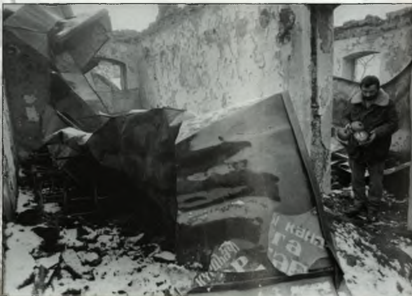
Erməni silahlı birləşmələri tərəfindən dağıdılmış infrastruktur, sosial, məişət obyektləri və yaşayış evləri