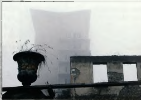
Erməni separatçıları tərəfindən dağıdılmış Azərbaycanın tarix və mədəniyyət abidələri