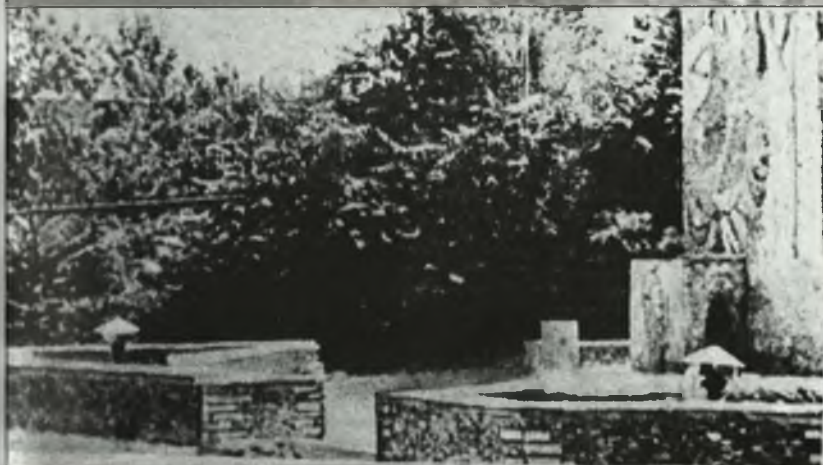
"150 il" abidəsi erməni separatçıları tərəfindən dağıdıldıqdan sonra. Ağdərə. 1988